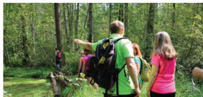
18.jūlijā, sestdienā, aizvadīts pēdējais pārgājienu cikls gar novada upītēm - Mārupīti, Nerīņu, Dzilnupi

Pateicamies visiem mārupiešiem un ciemiņiem no citām Latvijas pilsētām un novadiem, kas šovasar kopā ar mums izzināja mūsu novada upītes. Paldies atpūtas kompleksam “Bejas” par viesmīlību pēdējā pārgājienā.