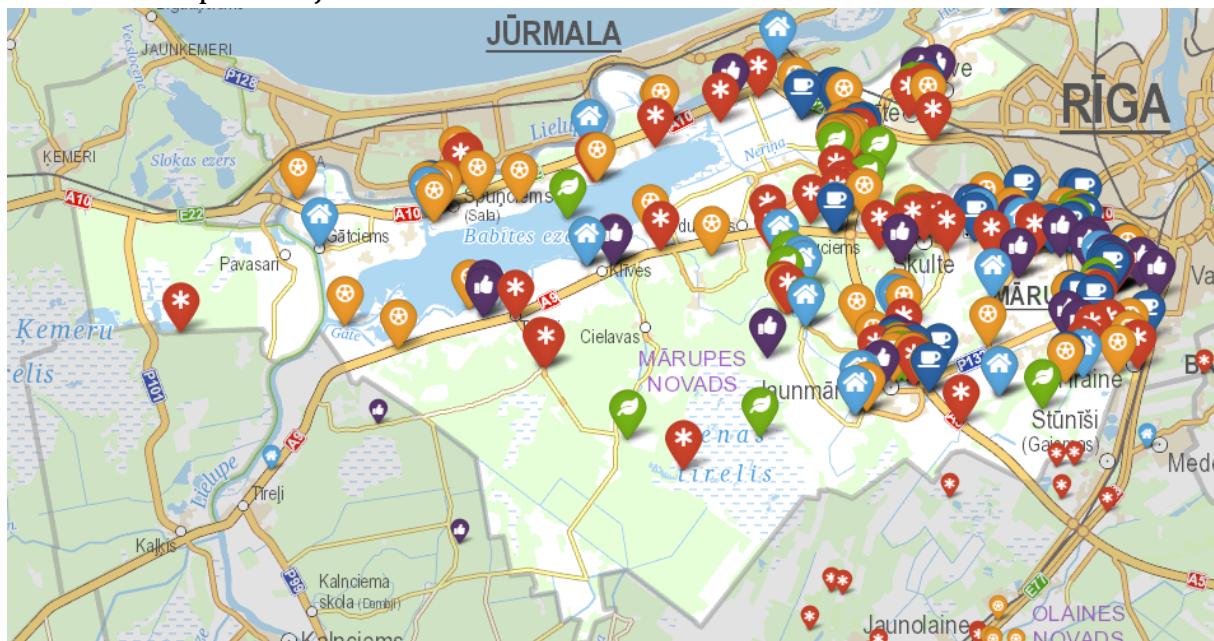
1. att. Tūrisma piedāvājuma koncentrācija Mārupes novada teritorijā 3

Novadam attīstoties, laika gaitā ir pilnveidojies tūrisma piedāvājuma klāsts, kurā tiek ietverti dabas un citi tūrisma apskates objekti, aktīvās atpūtas piedāvājumi, ēdināšanas vietas, naktsmītnes, kā arī amatnieku, mājražotāju un mākslinieku piedāvājumi.