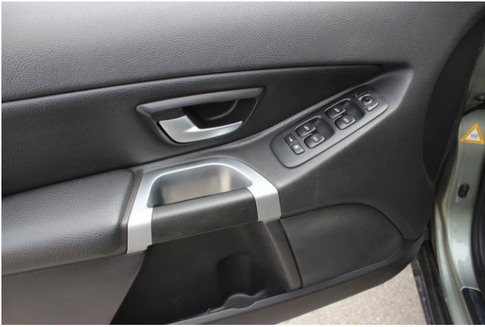
Attēls Nr. 15