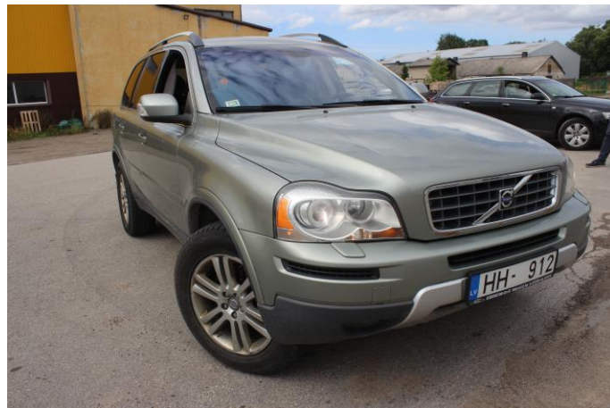
Attēls Nr. 2