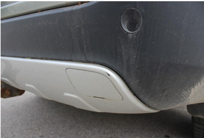
Attēls Nr. 9