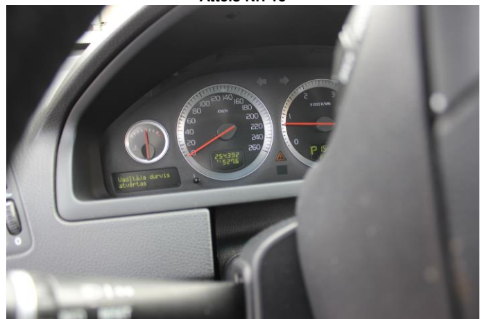
Attēls Nr. 20