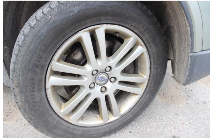
Attēls Nr. 8