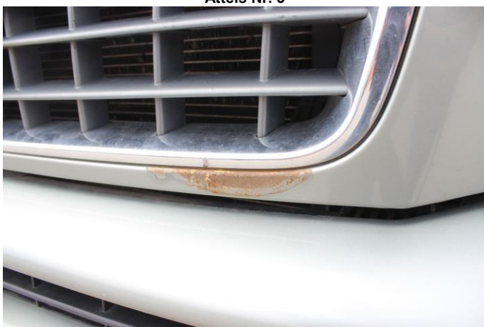
Attēls Nr. 5