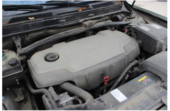
Attēls Nr. 16