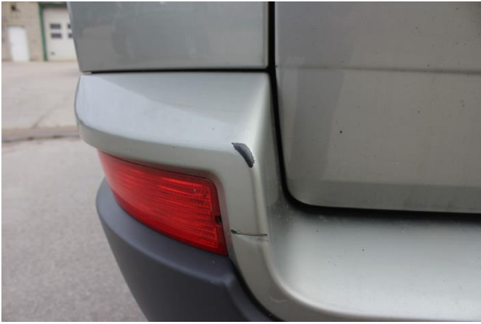
Attēls Nr. 7