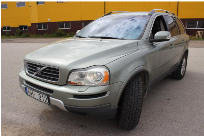
Attēls Nr. 1