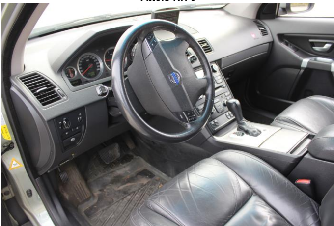
Attēls Nr. 11