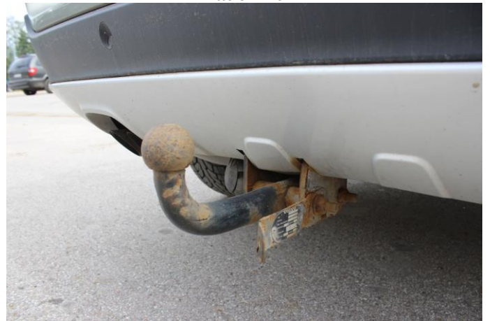
Attēls Nr. 10