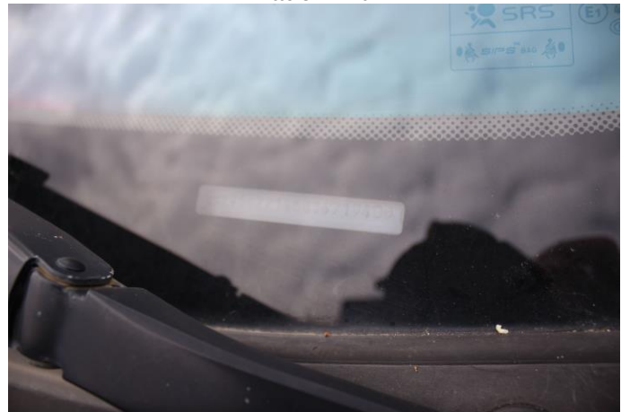
Attēls Nr. 18