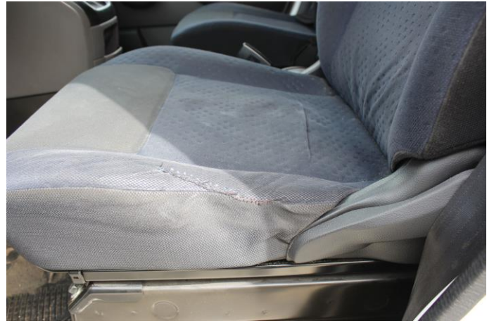
Attēls Nr. 24