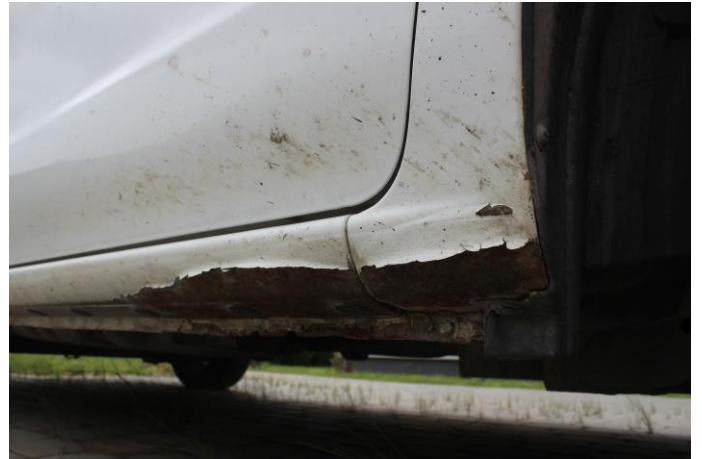
Attēls Nr. 8