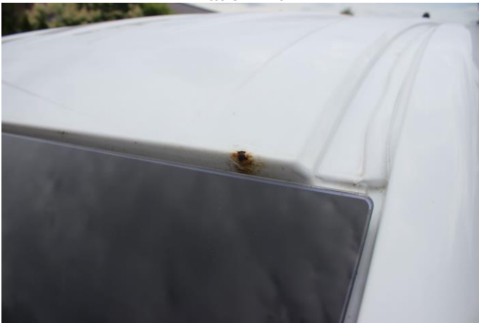
Attēls Nr. 17