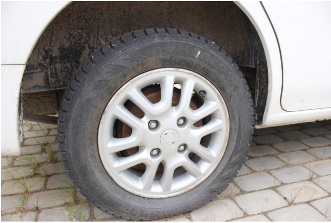
Attēls Nr. 7