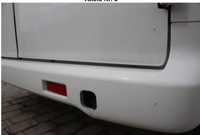
Attēls Nr. 5