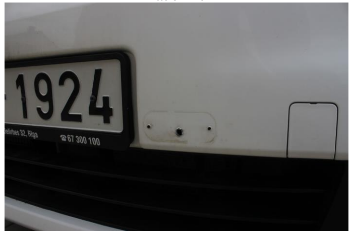
Attēls Nr. 10