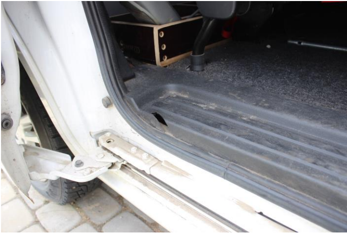
Attēls Nr. 23