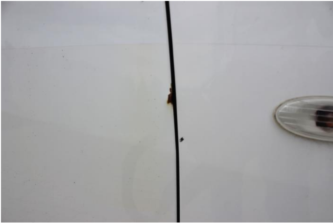
Attēls Nr. 15