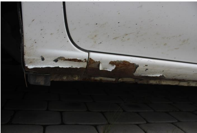
Attēls Nr. 11