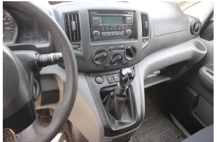
Attēls Nr. 26