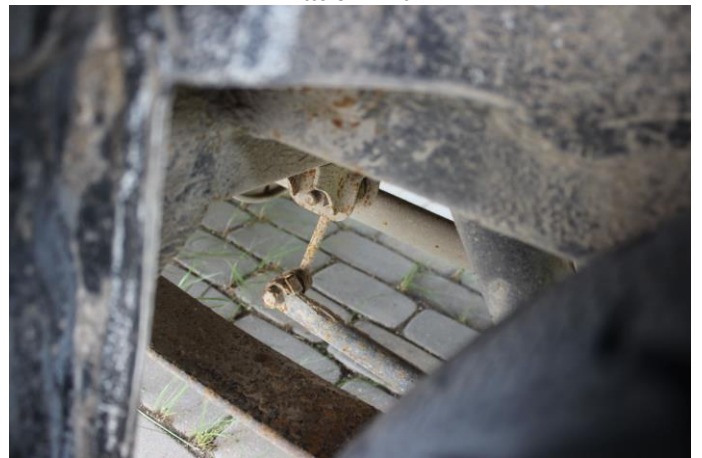
Attēls Nr. 12