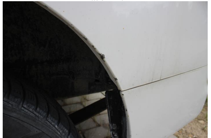
Attēls Nr. 18