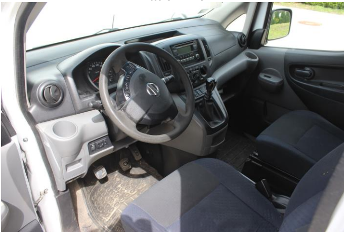
Attēls Nr. 25