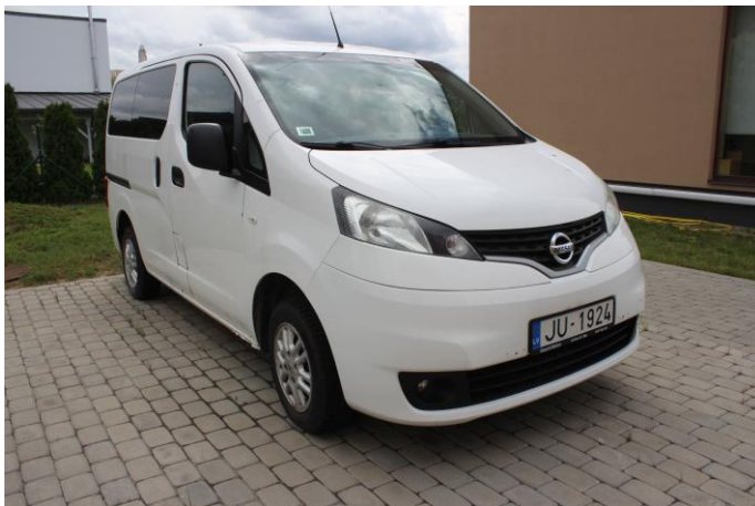
Attēls Nr. 1