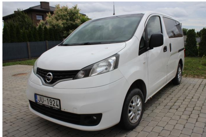
Attēls Nr. 2