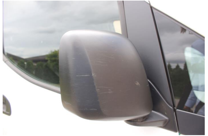
Attēls Nr. 16