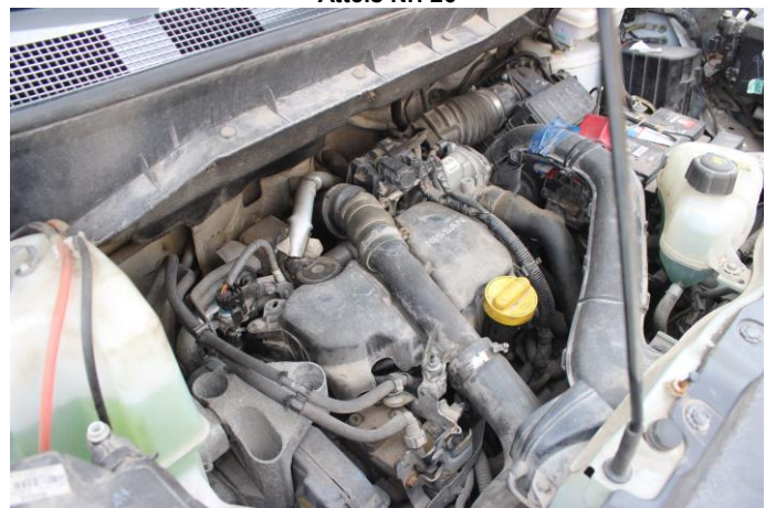
Attēls Nr. 28