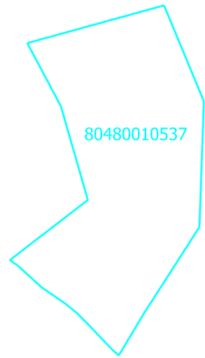
Projektētās teritorijas shēma pirms zemes ierīcības plāna izstrādes