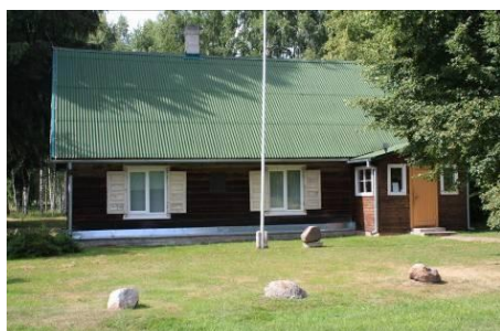
Mangaļu mājas