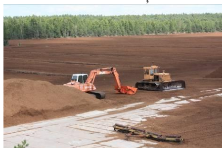
Izstrādātā Cenas tīreļa daļa