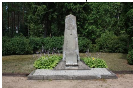
Tīreļu (Antiņu) kapi