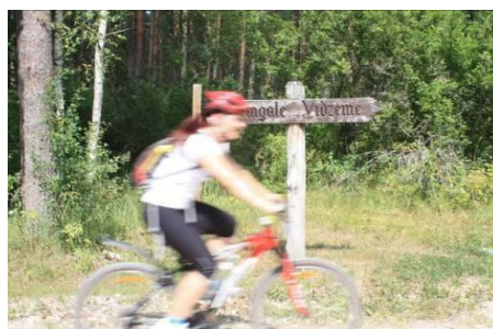
Vēsturiskā Zemgales – Vidzemes robeža