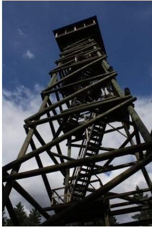
Ložmetējkalna skatu tornis