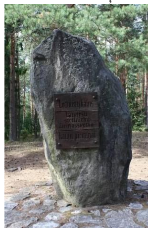
Piemiņas akmens Ložmetējkalnā