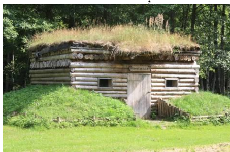
Zemnīcas pie Mangaļu mājām