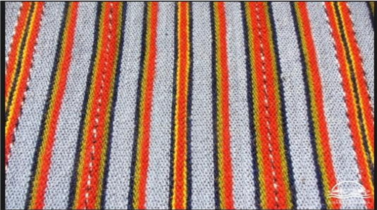
Pielikums Nr. 2