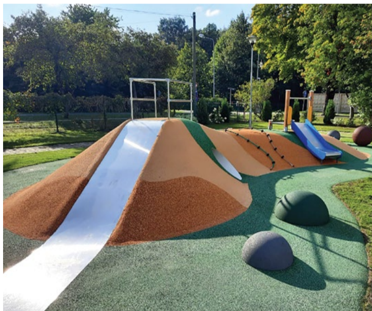
Jaunais rotaļu laukums Babītes pirmsskolas izglītības iestādes teritorijā.

Šogad skolā turpinās darboties skolēnu mācību uzņēmumu (SMU) darbība.