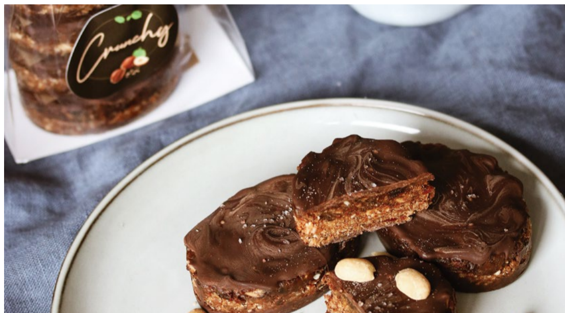
SIA "Crunchy", Elīnas Nelsones uzņēmums, nodarbojas ar veselīgu un uzturvielām bagātu saldumu ražošanu.