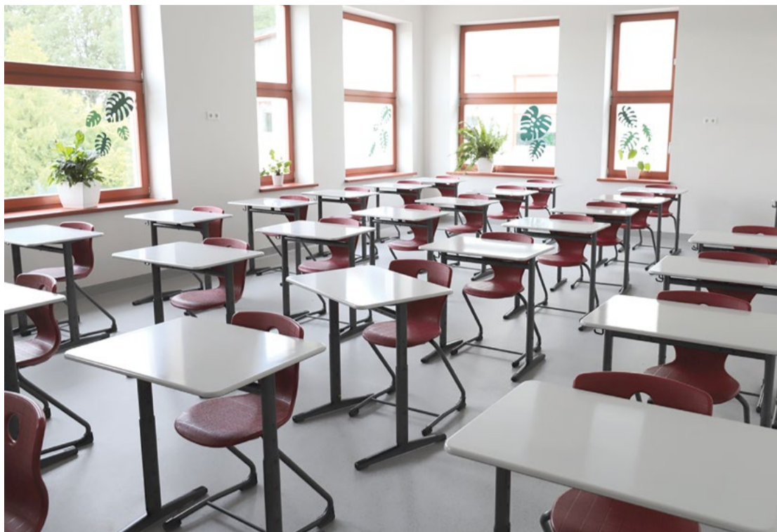
Jaunmārupes pamatskolā pārbūvētas pirmsskolas telpas, kurās turpmāk mācīsies apgūs 1.-3.klašu skolēni.

Ar 2021.gada 1.septembri 5.-9. klašu skolēni uzsāk mācības jaunajā skolas korpusā, kuru ekspluatācijā nodeva 2020.gada decembrī. Tajā