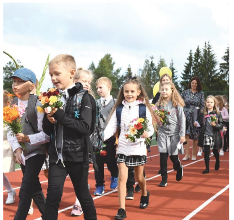
Skolas zvans ieskandināts Mārupes Valsts ģimnāzijā.

Plašāku informāciju par skolēnu testēšanu var meklēt Izglītības un zinātnes ministrijas tīmekļvietnē www.izm.gov.lv , sadaļā Informācija par Covid-19.