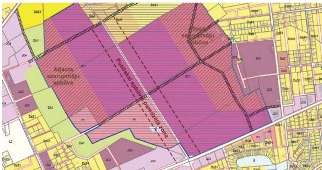
1.attēls. Bierīņu purva attīstības priekšlikums

Viens no būtiskiem jautājumiem, kas tika risināts TPG ietvaros, ir līdz šim noteikto Mazsaimniecību apbūves ārpus ciemiem teritoriju (DzSM) atļautās izmantošanas maiņa, jo iespēju veidot kompleksu dzīvojamo apbūvi ārpus ciemu teritorijām nepieļauj normatīvais regulējums. Vērtējot saņemtos institūciju nosacījumus un atzinumus, kā arī vadoties no normatīvā regulējuma saistībā ar apbūves izvietojumu trokšņa līmeņa pārsniegumu zonās, atsevišķas teritorijas, kas iepriekš bija noteiktas kā mazsaimniecības, turpmāk iekļautas ciema teritorijā (skatīt 2.attēlu), taču citās noteikts Lauksaimniecības teritoriju zonējums (pamatā teritorijas uz rietumiem no Vētru ciema, kuras ietekmē lidlauka radītais trokšnis, teritorijas ap Jaunmārupi un pie leķiem), pieļaujot līdzšinējos izmantošanas veidus, bet ierobežojot iespēju sadalīt zemi