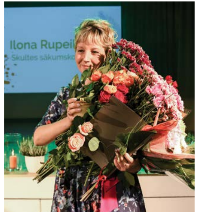
Ilona Rupeika Skultes sākumskola