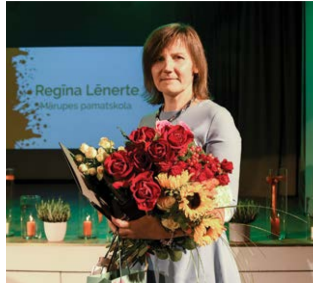
Regīna Lēnerte Mārupes pamatskola

Skolotāji Līvu raksturo kā pozitīvu, smaidīgu, sirsnīgu, izpalīdzīgu un uz sadarbību vērstu kolēģi, kura labprāt dalās ar savām bagātākajām idejām un zināšanām.