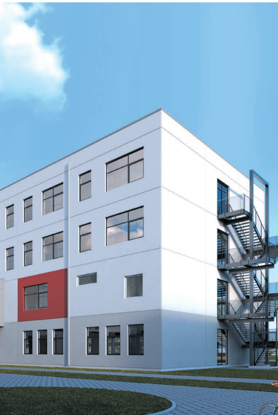
Mārupes pamatskolas jaunā korpusa vizualizācija

Jaunā piebūve būs četrstāvu ēka ar kopējo platību 6200 m 2 . Tajā plānots izvietot 37 mācību klases, laboratorijas un darbnīcas 5. līdz 9.klašu skolēniem, bibliotēku, dejošanas zāli, kā arī telpas atbalsta centram un skolas administrācijai. Tādējādi skolā kopumā tiks nodrošināta iespēja mācīties apgūt 1000 skolēniem, kas ir gandrīz divas reizes vairāk nekā šobrīd.