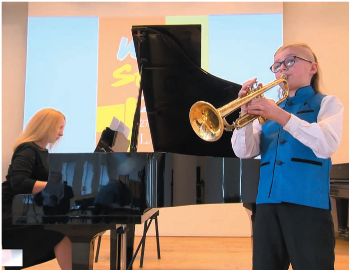
Konkursā piedalījās 300 dalībnieki, kas demonstrēja savu meistarību dažādu pūšaminstrumentu spēlē

Starptautisko pūšaminstrumentu spēles jauno izpildītāju konkursu „WIND STARS 2020” organizēja Mārupes Mūzikas un mākslas skola sadarbībā ar starptautisko mūzikas skolu asociāciju „CON ANIMA”.