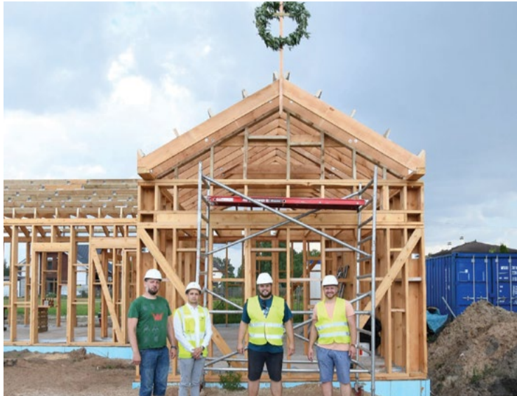
Jauniešu mājas spāru svētkos piedalījās būvnieka, projektētāja un pašvaldības pārstāvji

Jauniešu centra ēkai Dreimaņu ielā 12, Mārupē, 2.jūlijā atzīmēti spāru svētki. Nelielā ēka ieguvusi savas aprises un tās augstākajā punktā pacelts vainags.