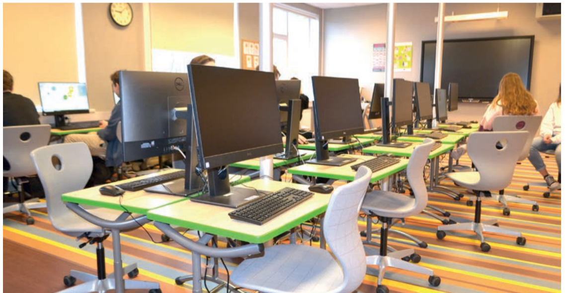
Ģimnāzijā datorklases aprīkotas ar jauniem datoriem un ergonomiskiem krēsliem

Projekta ietvaros iegādāti arī multifunkcionāli podesti mācību darba un prezentēšanas prasmju veiksmīgākai nodrošināšanai.