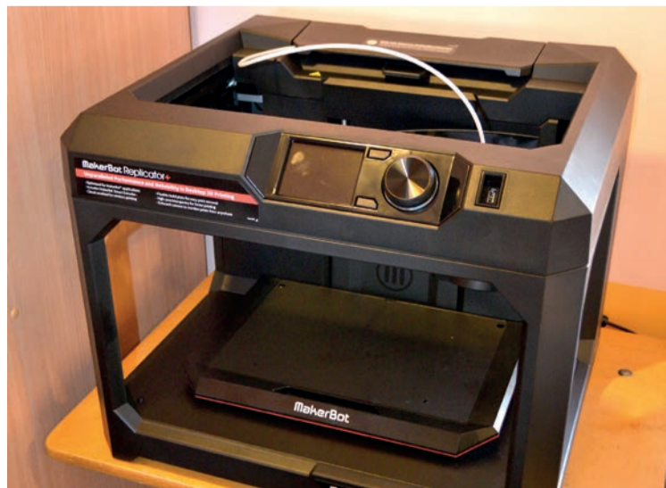
Skolai iegādāti 3D printeri, kas ļaus skolēniem apgūt iemaņas telpisku objektu modelēšanā