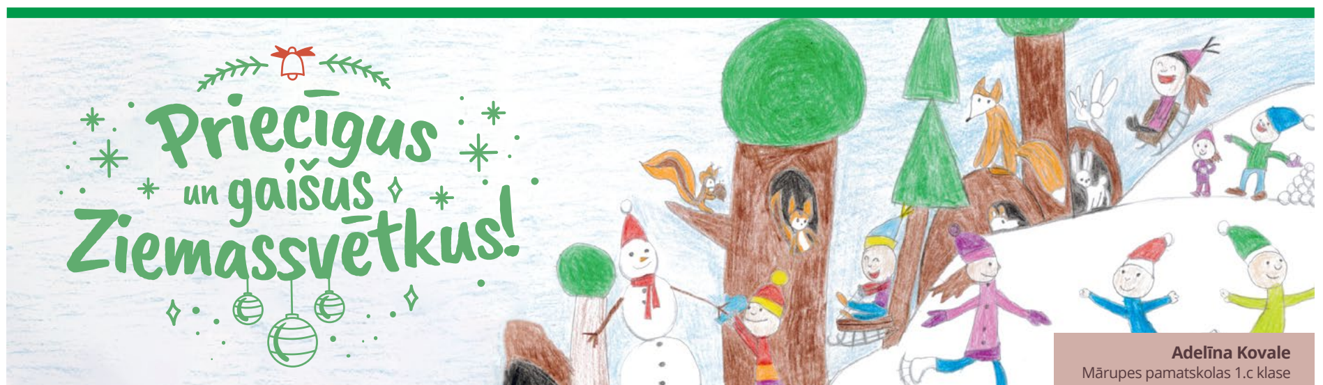
Adelīna Kovale Mārupes pamatskolas 1.c klase

Sabiedrības iesaistes un marketinga nodaļa