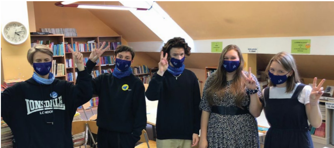
Mārupes Valsts ģimnāzijas jauniešu komanda piedalās projektā "Eiropas Parlamenta Vēstnieku skola".

Mārupes Valsts Ģimnāzijas 10. un 8. klases skolēni ir izveidojuši komandu un piedalās Eiropas Parlamenta organizētā projektā "Eiropas Parlamenta Vēstnieku skola", kas Latvijā notiek jau kopš 2016./2017. mācību gada.