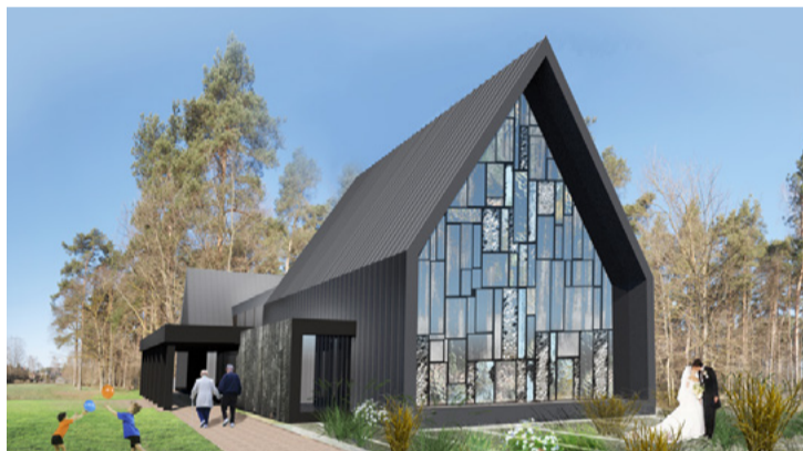
Kultūras un garīguma centra "Kairos" vizualizācija.

28. martā Zoom tiešsaistē notika pašvaldības organizētā kultūras un garīguma centra "Kairos" projekta pārstāvju tikšanās ar Jaunmārupes iedzīvotājiem. Tās laikā klātesošajiem bija iespēja uzklaušēt projekta attīstītājus, kā arī saņemt atbildes uz interesējošiem jautājumiem par projekta virzību.