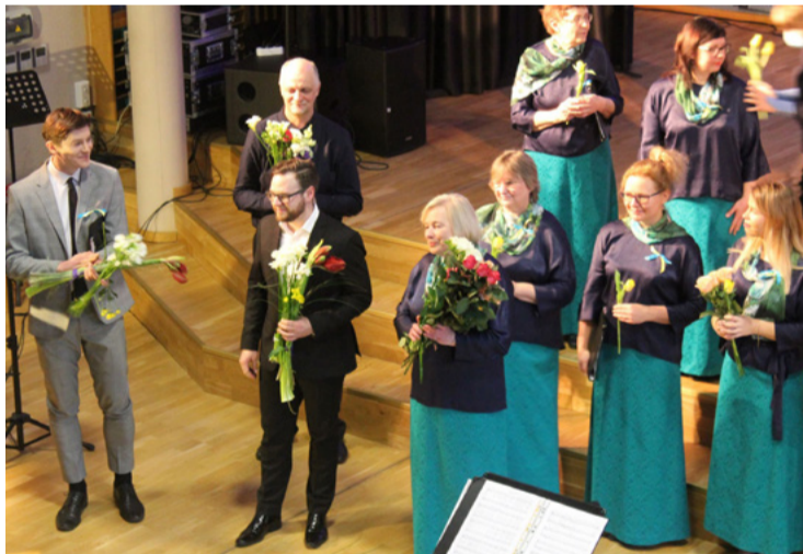
Jauktais koris "Atskaņa" ērģelmūzikas koncertu veltā Ukrainai un aizsaulē aizgājušo bijušo Babītes kultūras darbinieku un viņu piederīgo piemiņai.