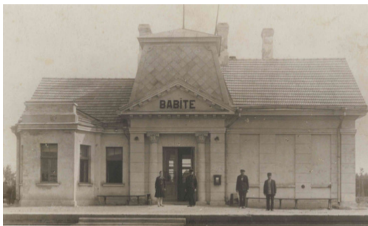
Babītes stacija 1925. gadā.