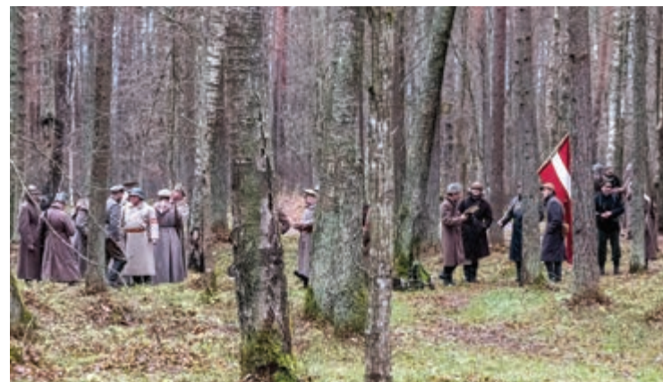
Aina no Brīvības cīņu kauju rekonstrukcijas

1919.gada 8.oktobra rītā Bermonta armija sāka uzbrukumu Rīgas virzienā jeb operāciju «Zibens spēriens». Bermontiēši ātri vien ielauzās Rīgā un 10.oktobrī ieņēma visu Pārdaugavu, taču tālāk nevirzījās, tādējādi pieļaujami kļūdu... Šajā laikā Latvijas armijas dienvidu frontē valdīja nepārtraukta kaujas situācija un karavīri, kuriem nācās izturēt pirmo triecienu, nebija ne gulējuši, ne arī