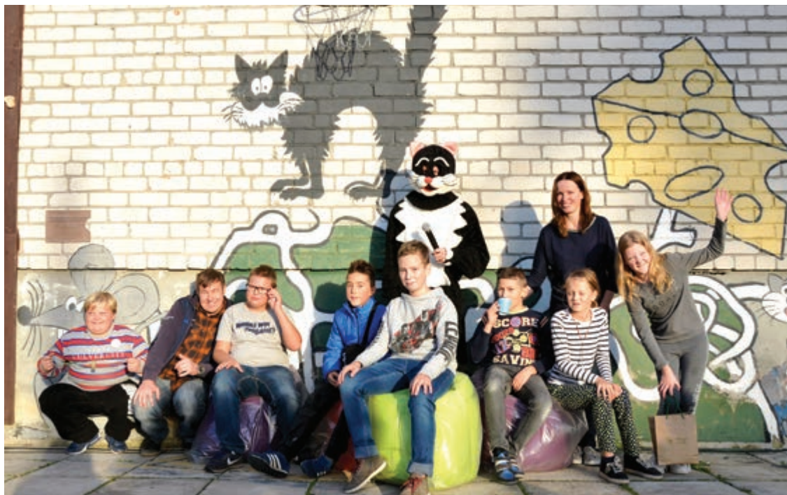
Dienas centra "Tīraine" vadība, bērni un kaķis Herkuss uz pašvaldības dāvinātajiem pufiem

Šogad aprit 10 gadi kopš dibināts dienas centrs "Tīraine", kas ik dienas sniedz psihosociālo palīdzību, sociālo prasmju un iemaņu attīstības, izglītošanas un brīvā laika pavadīšanas iespējas Mārupes novada iedzīvotājiem.