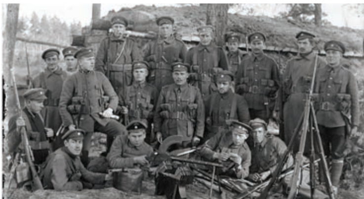
6. Rīgas kājnieku pulka 3. bataljona karavīri ierakumos Rīgas apkaimē Bermonta armijas uzbrukuma laikā 1919. gada oktobris - novembris.

Bermontiādes notikumi Latvijas vēsturē ieguvuši leģendāru statusu, jo Latvijas armijas uzvara pār Bermonta karaspēku pie Rīgas faktiski izšķīra Latvijas Neatkarības kara jeb Brīvības cīņu iznākumu. Pēc I Pasaules kara vācu ģenerālis Rīdigers fon der Golcs nepameta Latviju un slepeni noslēdza līgumu ar krievu pulkvedi Pāvelu Bermontu. Viņiem laika posmā no 1919.gada jūnija sākuma līdz oktobrim izdevās sagrupēt ap 45 tūkstošus karavīru savai vācu un krievu algotņu armijai, kuras rīcībā bija ap 100 lielgabalu, 600 ložmetēju, 120 lidmašīnu un cita tehnika. Arī Latvijas armijas vadībai 1919.gada vasaras beigās kļuva skaidrs, ka steidzami jāstiprina aizsardzība ap Rīgu. Gaidot bermontiešu uzbrukumu, tiek izveidota Latvijas armijas dienvidu frontē 32km garumā ar aptuveni 20 tūkstošiem karavīru.