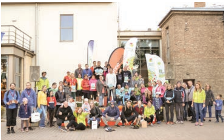
Velo foto orientēšanās sacensību seriāla "Apceļo Daugavas lejteci" Mārupes posma un kopvērtējuma uzvarētāji

Savukārt, sporta cienītājiem bija iespēja mēroties spēkiem, piedaloties velo foto orientēšanās sacensībās. Ar pēdējo, septīto sacensību posmu Mārupes novadā noslēdzās šīs vasaras aktīvās atpūtas piedzīvojums septiņos Rīgas apkārtnes novados – velo foto orientēšanās seriāls "Apceļo Daugavas lejteci". Seriāla ietvaros, laikā no 12.maija līdz 22.septembrim, visi interesenti ar velosipēdiem varēja kopā iepazīt 210 ievērojamas un interesantas vietas Rīgas tuvējos novados – 30 vietas katrā no