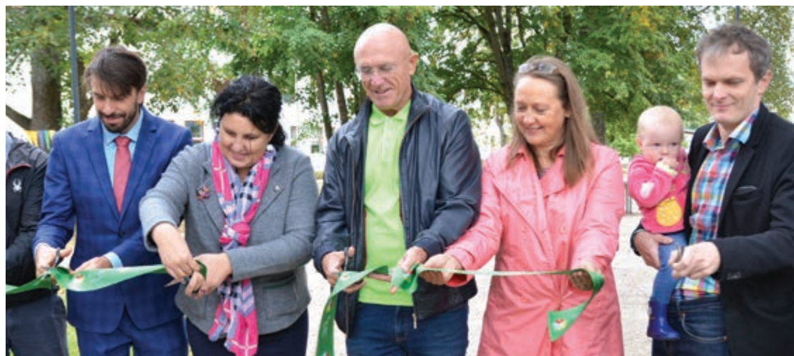
Domes pārstāvji un iesaistītie būvnieki svinīgi atklāj Švarcenieku muižas parku

22.septembrī Mārupes novadā svinīgi atklāti divi parki - atjaunotais Švarcenieku muižas parks Jaunmārupē un Skultes dabas parka taka. Parki labiekārtoti un atjaunoti, pateicoties pašvaldības un biedrības „Pierīgas Partnerība” iniciatīvai, piesaistot Eiropas Lauksaimniecības fonda lauku attīstībai finansējumu.