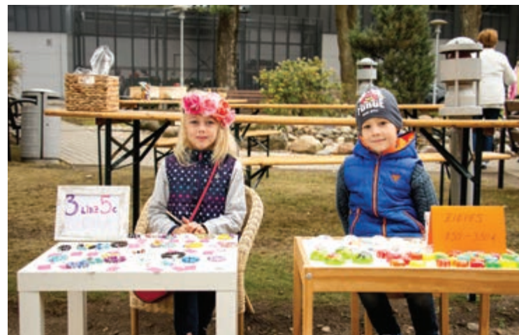
Rudens ražas gadatirgus jaunākie dalībnieki

Mārupes novada posmā tika apbalvoti arī visa seriāla kopvērtējuma uzvarētāji abās grupās - komandas, kuras visas vasaras garumā bija sakrājušas lielāko punktu skaitu, piedaloties visos posmos. Par visa seriāla ātrāko un acīgāko komandu Sporta grupā kļuva komanda "Svētdienas braucēji", otro vietu izcīnīja komanda "Spararats" un 3.vietu ieguva komanda "Zeltrači". Izklaides grupā kā absolūtie uzvarētāji triumfēja komanda "Lieliskais arbūzs". Otro vietu ieguva komanda "Kopā jautrāk" un 3.vietā ierindojās