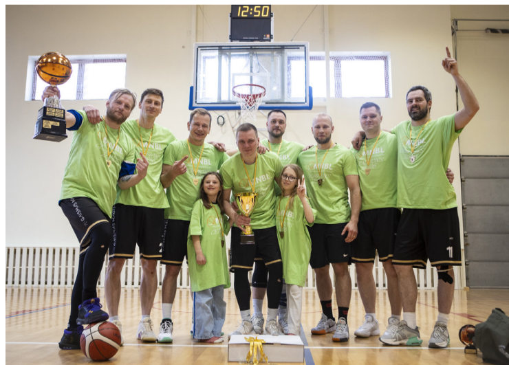
Mārupes novada basketbola līgas 2025./2026. sezonas čempioni – komanda "Gaismas maģija".