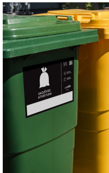
Pictogramma nešķirotajiem sadzīves atkritumiem ir melnā krāsā.