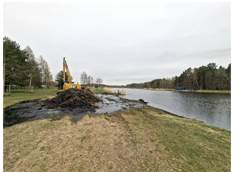
Piņķu ūdenskrātuves tīrīšanas darbi.

Attīstības un plānošanas pārvalde, Pašvaldības īpašumu pārvalde