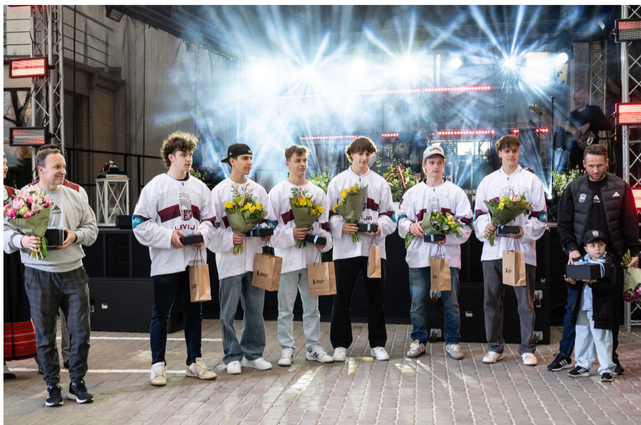
Godinām novadniekus – Latvijas U-18 hokeja izlases spēlētājus – par izcīnīto 4. vietu pasaules čempionātā.