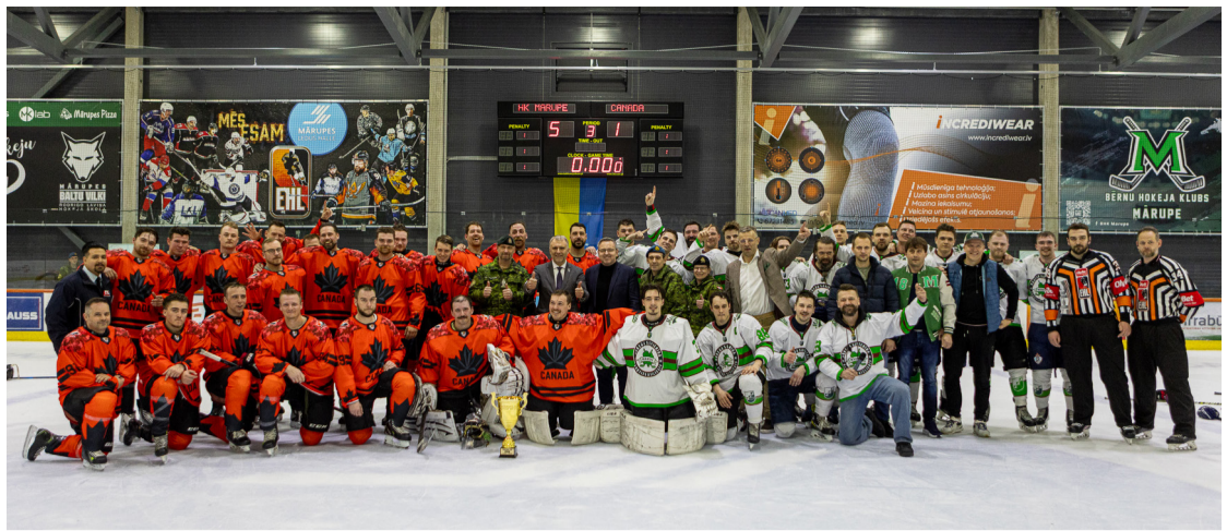
Mirklis no hokeja spēles "Brīvības kauss 2026" Mārupes Ledus hallē.