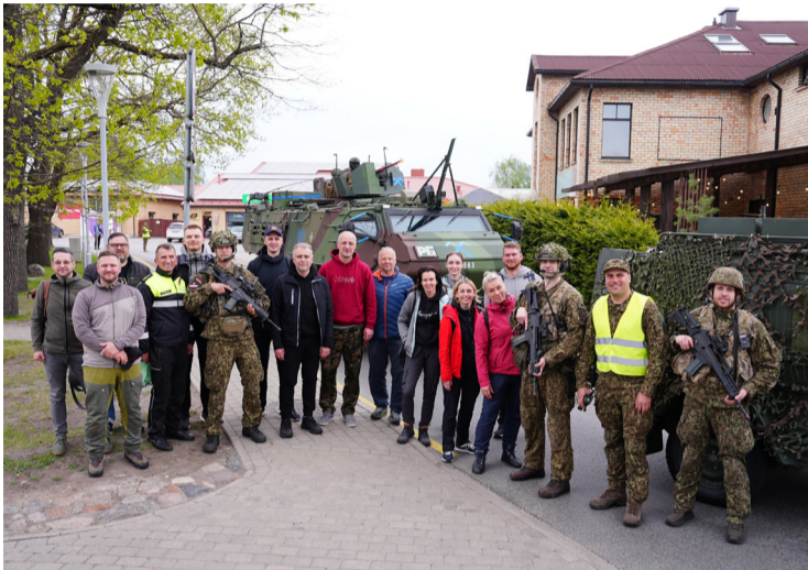
Civilās aizsardzības mācības pašvaldības iestāžu darbiniekiem.