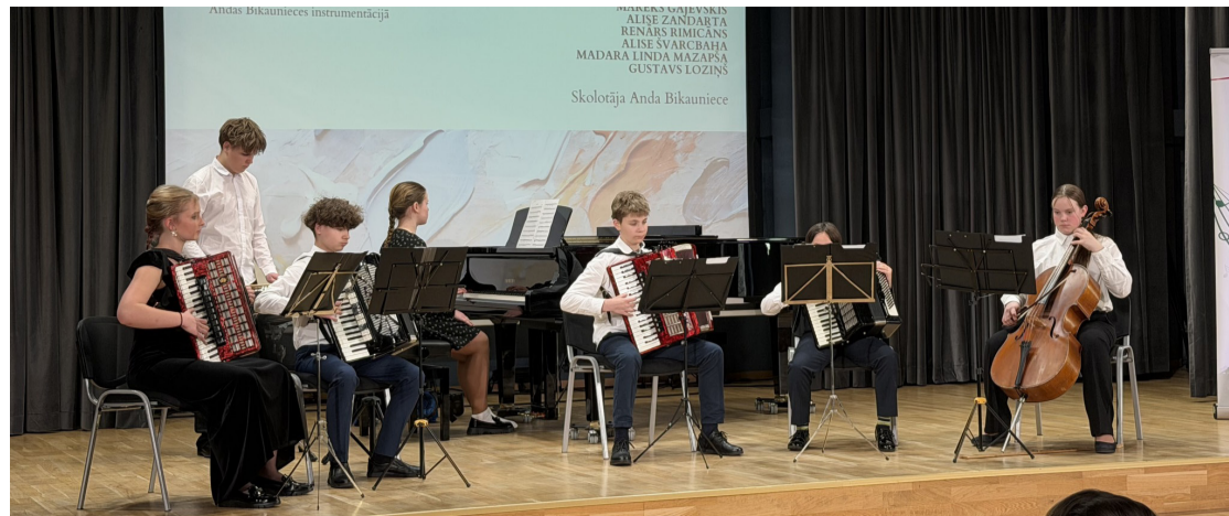
Babītes Mūzikas skolas instrumentālais ansamblis.