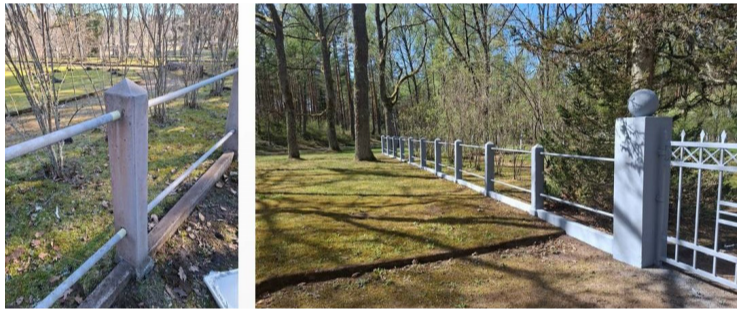
Antiņu kapsētas žogs pirms un pēc remontdarbiem.