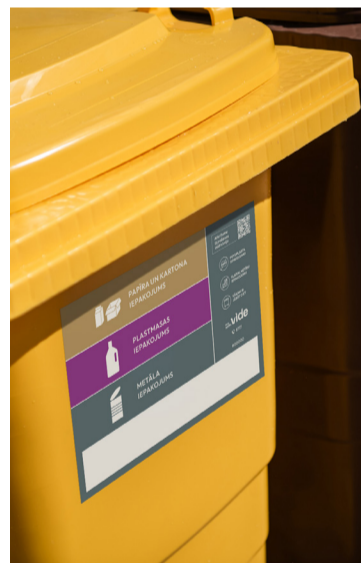
Vieglā iepakojuma konteinerā jaunais marķējums.