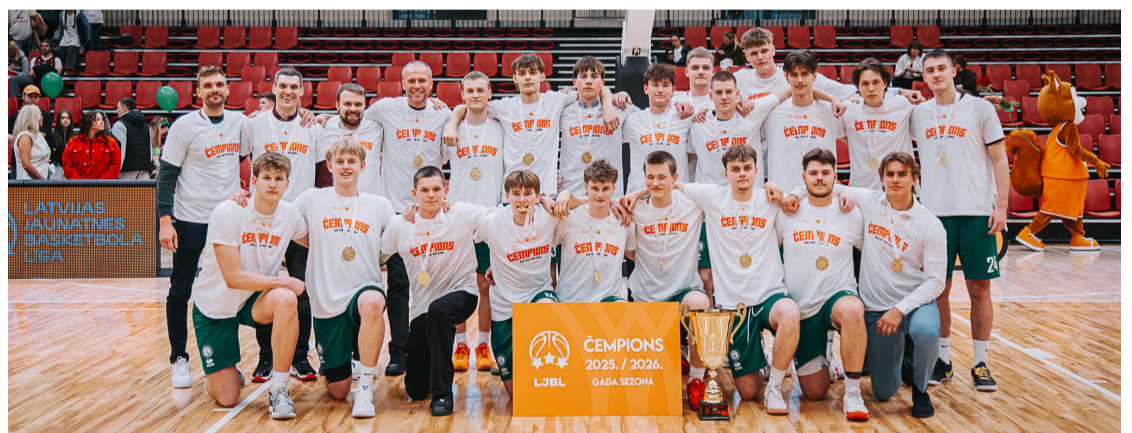
Mārupes novada Sporta skolas U-19 zēnu basketbola komanda Latvijas Jaunatnes basketbola līgas finālturnīrā.