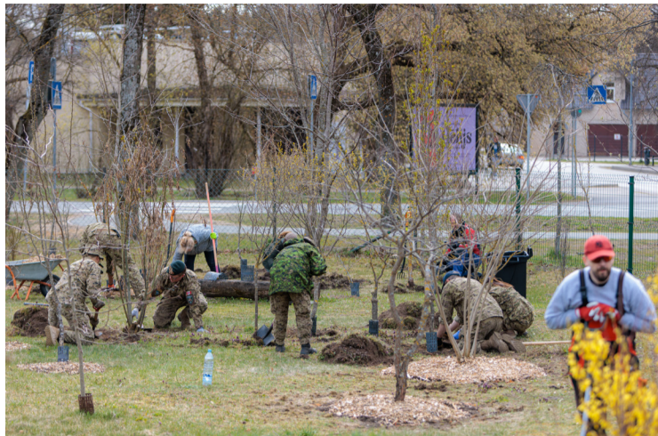
Mirkļis no talkas Pūpes parkā.

Kopumā talkas ietvaros Mārupes novadā tika savāktas un atkritumu poligonā "Getliņi" nogādātas 1,26 tonnas atkritumu un 36 dažādas automašīnu riepas.