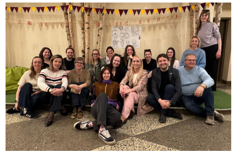
Pilotprojekta “Jaunatnes darbinieks skolā” īstenošanu komandas no Mārupes, Tukuma, Cēsu un Līvānu pašvaldības, Jaunatnes starptautiskās programmu aģentūras komandas pārstāvji.

Nupat Cēsu Jauniešu mājā esam aizvadījuši pilotprojekta mācību pirmo moduli. Tā ietvaros mūsu speciālisti analizēja gan praktiskos, gan ētiskos un juridiskos aspektus šādas sistēmas ieviešanai. Smēlāmies iedvesmu no Somijas un Lietuvas skolu pieredzes, kā arī devāmies pieredzes apmaiņā uz Vecpiebalgas un Jaunpiebalgas vidusskolām un Jaunpiebalgas jauniešu centru, kur līdzīga sistēma jau sekmīgi darbojas.