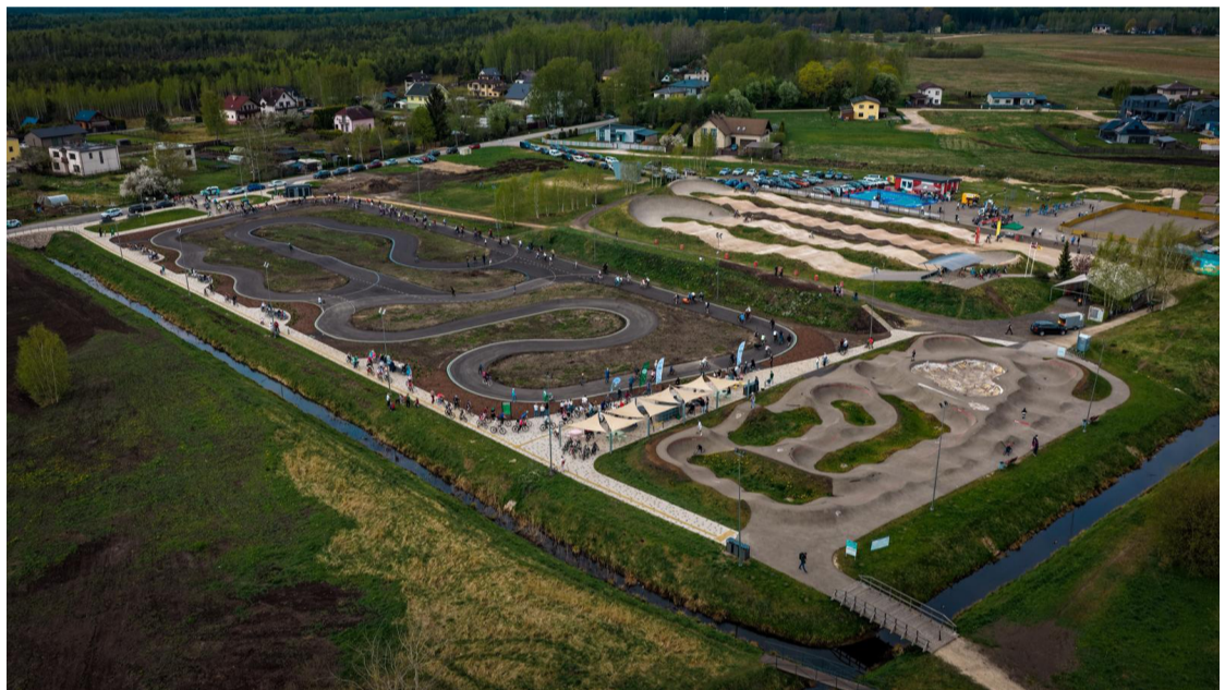
Skats uz BMX aktīvās atpūtas parka, skrituļošanas trasi un velotrases teritoriju.

Sabiedrības informēšanas un mārketinga nodaļa