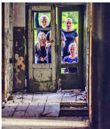
Foto no iepriekš notikušajiem festivāla "Vides dejas" notikumiem.

Vides dejas (angl. site-specific dance ) ir laikmetīgās dejas mākslas izteiksmes veids. Tā pārveido ierastos priekšstatus par izrādi un