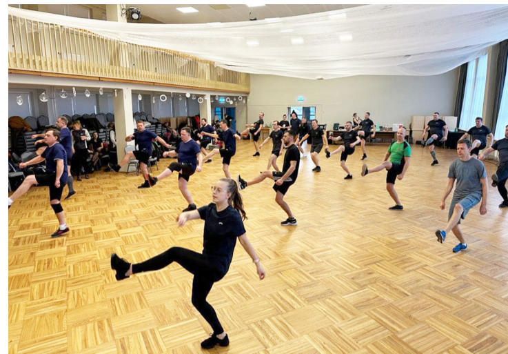
Mirklis no uzveduma mēģinājuma.

Sabiedrības informēšanas un multimediju nodaļa