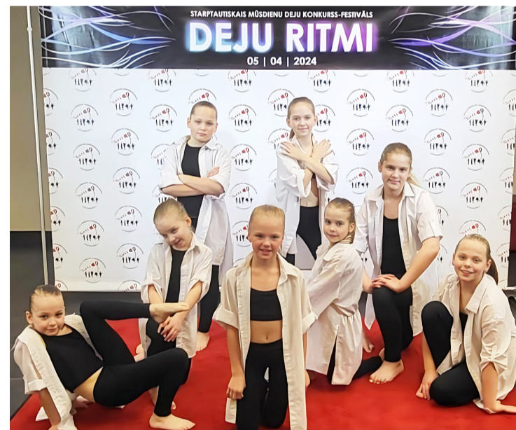
Deju grupas "Platīns" dalībnieces.

Sabiedrības informēšanas un multimediju nodaļa