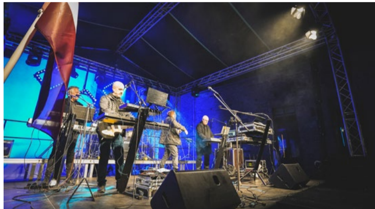
Lieliska iespēja valsts svētku gaisotnē baudīt leģendārās latviešu rokgrupas "Jumprava" sniegumu.

Svētku fotogalerijas un video atskati atrodami www.marupe.lv .