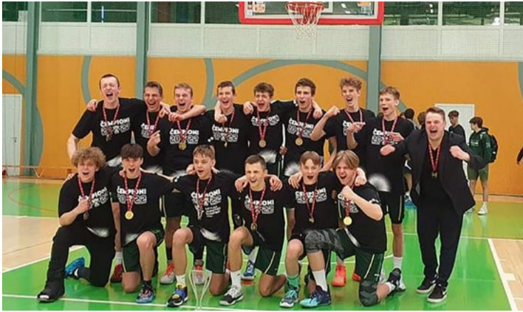
Latvijas čempioni - Mārupes Sporta centra U16 basketbola komanda.

27. martā Daugavpilī notika 5. Latgales WKF karatē čempionāts, kurā piedalījās 220 sportisti no 12 Latvijas, Lietuvas un Igaunijas karatē klubiem. Karatē klubu „Ippon” pārstāvēja 13 sportisti. Klubu kopvērtējumā 12 klubu konkurencē tika izcīnīta 5.vieta. No Mārupes novada klubu pārstāvēja Rūta Auzenbaha, kura piedalījās kumite (ciņa ar pretinieku) disciplīnā un izcīnīja godalgoto 3. vietu.