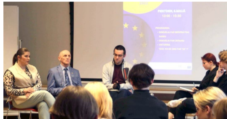
“Eiropas diena Mārupē” aizvadīta paneldiskusijās par aktuāliem jautājumiem.

6. maijā Mārupes Valsts ģimnāzijas skolēni kopā ar skolotājiem organizēja Eiropas Parlamenta vēstnieku skolas programmas pasākumu “Eiropas diena Mārupē”.