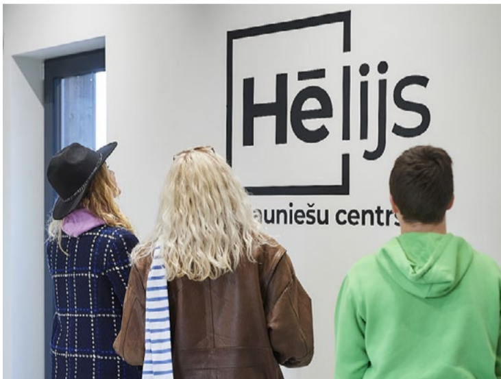
Jaunieši centram devuši vārdu “Hēlijs”.

Mārupē ir vieta, kas strauji attīstās, tepat atrodas arī Starptautiskā lidosta “Rīga”. Tāpat arī jauniešu centrs “Hēlijs” ir vieta, kur lidot idejām. Jaunieši vēlas, lai šī māja palīdz pacelt viņu idejas un motivē tās īstenot. Atslēgais vārds ir “augšupeja”.