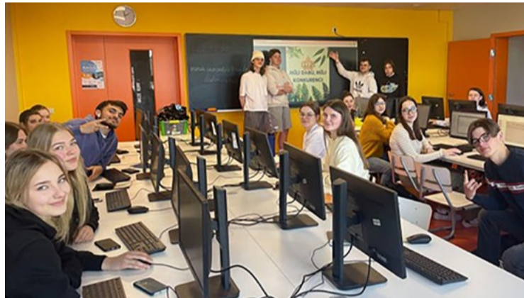
Projekta kampaņu prezentācija.

#NVOfonds2022 #iacedu 2022.LV/NVOF/MAC/010/06. Projekta finansiāli atbalsta Sabiedrības integrācijas fonds no Kultūras ministrijas piešķirtajiem Latvijas valsts budžeta līdzekļiem.