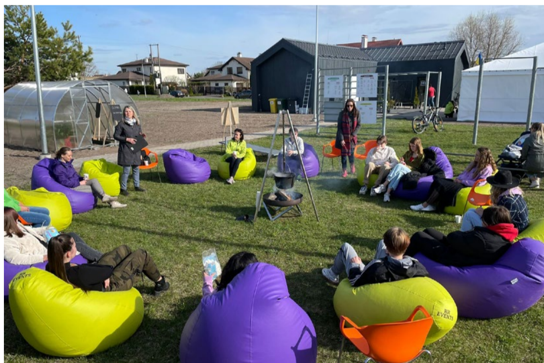
Sirsnīgā atmosfērā pie ugunsкура tiek diskutēts par ZERO WASTE idejām un kompostēšanu.

Sabiedrības iesaistes un mārketinga nodaļa