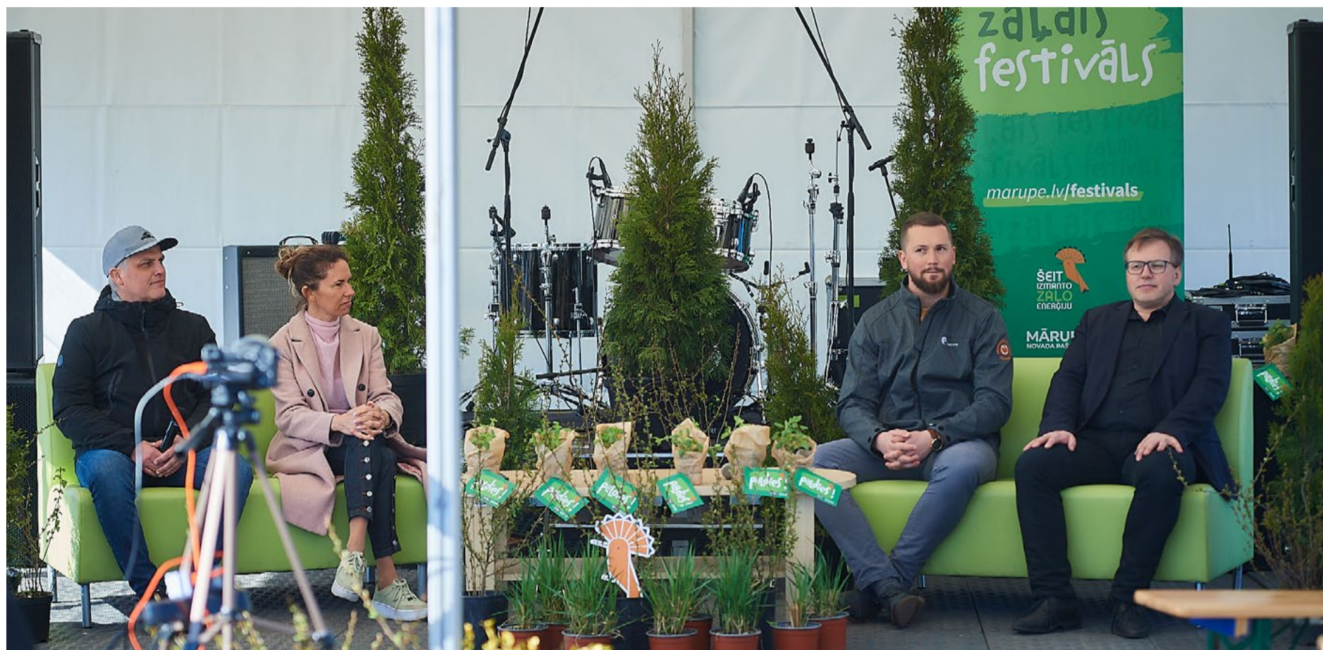
Zaļo un Viedo Tehnoloģiju Klastera vadītās diskusijas tēma - “Vai ražot enerģiju ar sauli ir tikai modes lieta?”

Izskanējais tradicionālais Mārupes “Zaļais festivāls”, kas šogad norisinājās 29. un 30. aprīlī Dreimaņu ielā 12, Mārupē, un piedāvāja plašu pasākumu programmu bērniem un pieaugušajiem.