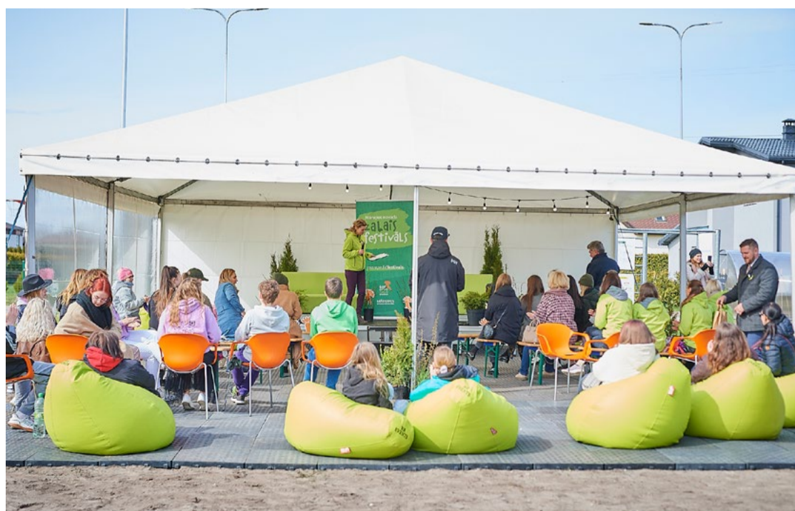
Zaļā festivāla panākumu atslēga - neformāla atmosfēra.