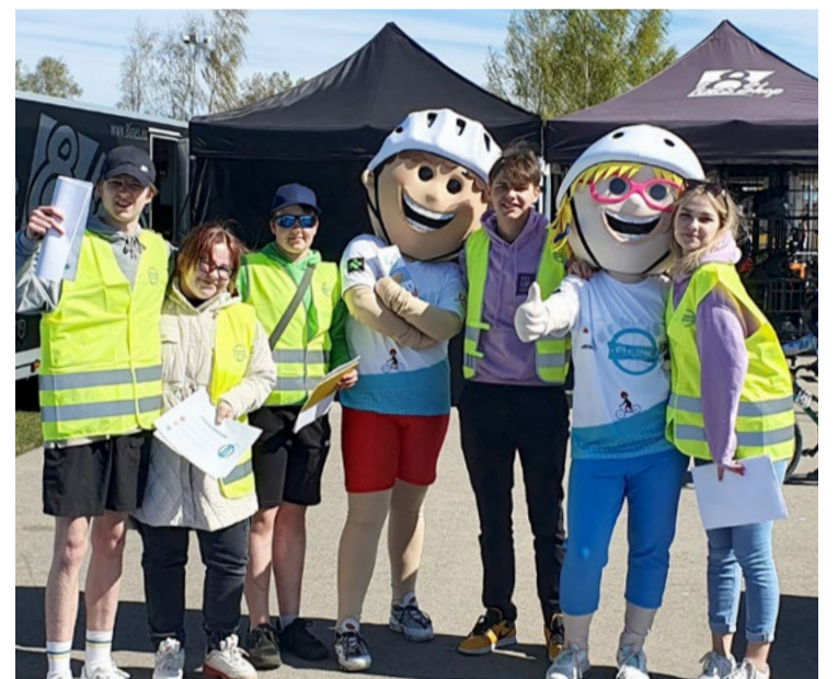
Mārupes novada Jauniešu domes organizētajās aktivitātēs labprāt iesaistījās ikviens klātesošais.