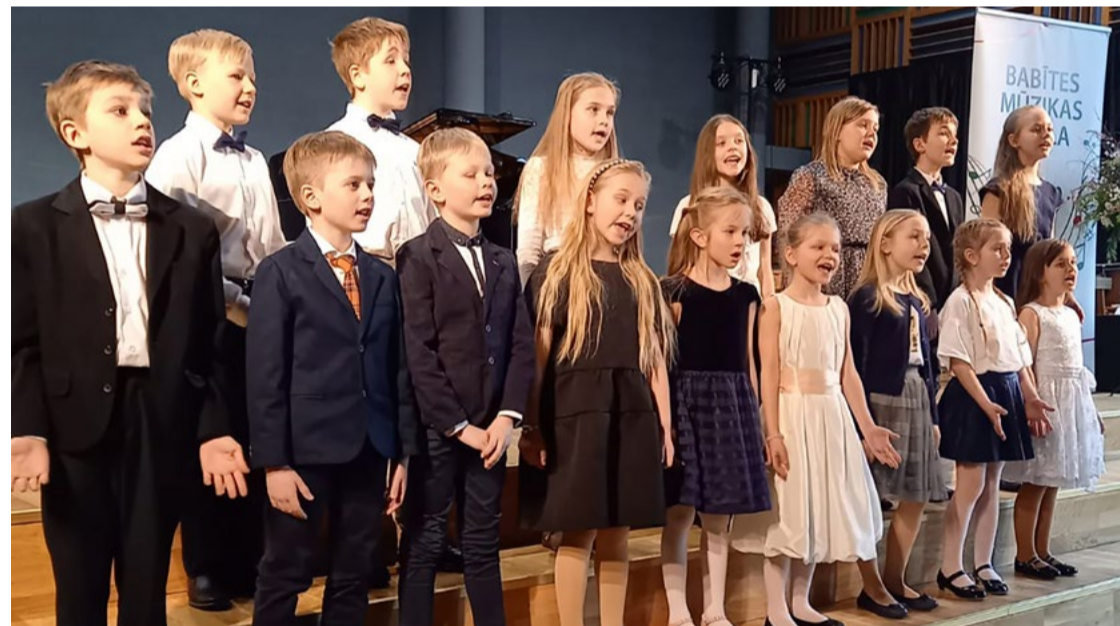
Sagatavošanas klašu kora priekšnesums pavasara koncertā “O-la-lā”.

Pavasaris, kā jau ierasts, ienāk ar savu rosību - pasākumiem, koncertiem un panākumiem konkursos.