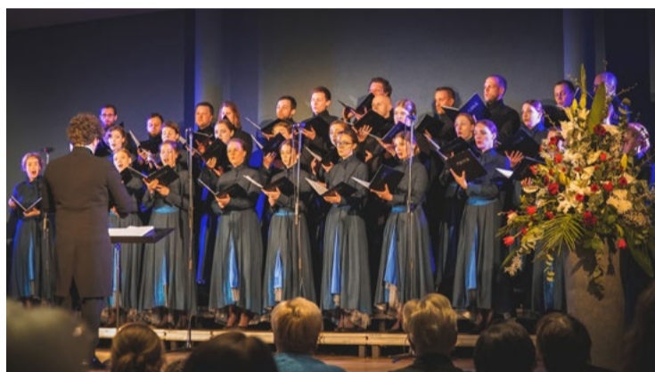
Ar svētku noskaņu 4. maija pasākumu kuplīnāja Babītes Kultūrizglītības centra jauktais koris "Maska".