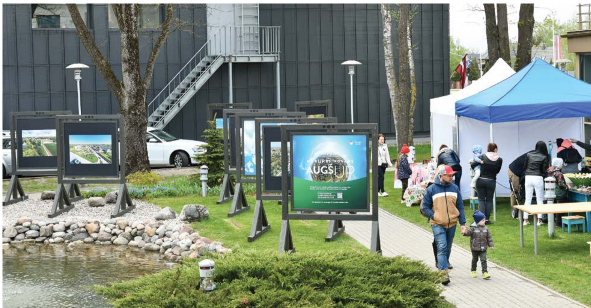
Par godu valsts svētkiem Mārupes Kultūras nama pagalmā pie strūklakas atklāta jauna izstāde "Mārūpes novads augšUP"

4.maijā Mārupes novadā tika godināta Latvijas valsts neatkarības atjaunošana un atklāta Aktīvā tūrisma sezona. Spītējot mainīgajiem laikapstākļiem un islaicīgajām, bet vētrainajām lietusgāzēm, dienas ietvaros iedzīvotāji un citi interesenti apmeklēja jau tradicionālo Mārupes novada Pavasara gadatirgu, kurā savus ražojumus piedāvāja vietējie novada amatnieki, mājrāzotāji un mākslinieki.