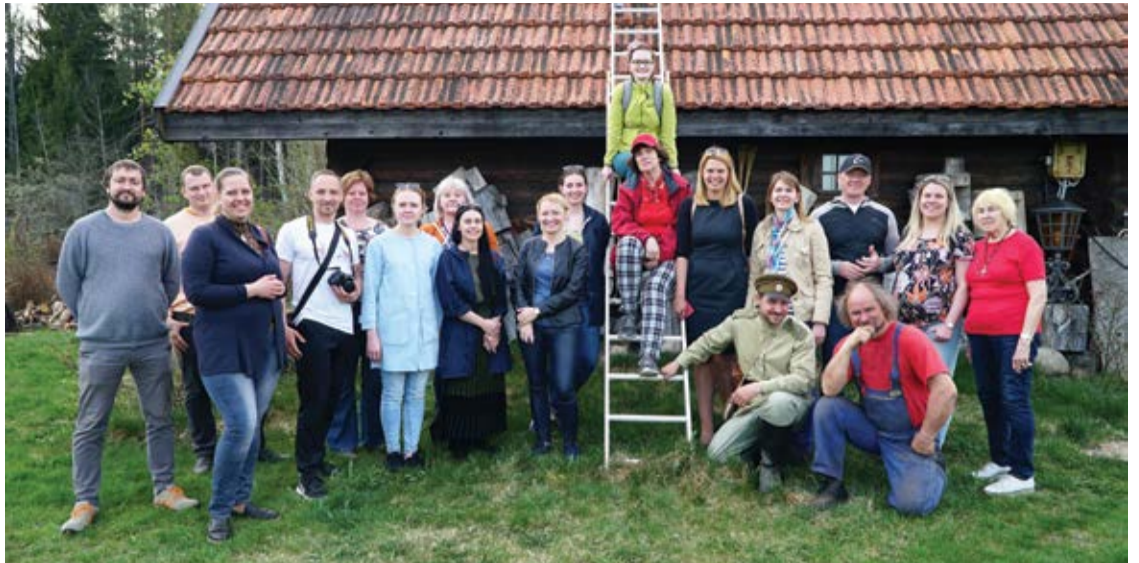
Tūrisma profesionāļi pirmajā pieredzes apmaiņas braucienā Olaines novadā

Projekta „Tūrisms kopā” ietvaros no aprīļa līdz septembrim tiek organizēti pavisam kopā seši bezmaksas pieredzes apmaiņas braucieni tūrisma jomas profesionāļiem – tūrisma pakalpojumu sniedzējiem, gidem un tūrisma speciālistiem.