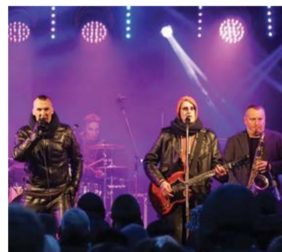
Leģendārā rokgrupa "Līvi" pieskandināja Mārupes Kultūras nama iekšpagalmu