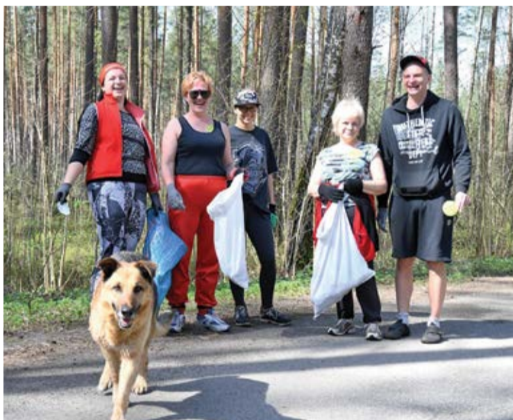
Kādā sarunā pie meža Jaunmārupē iedzīvotāji norādīja, ka šogad atkritumu ir mazākā skaitā nekā iepriekšējos gados. Par to prieks!

Aprīlī pašvaldība organizēja akciju „Sakopsim mūsu Mārupi, mūsu mājas”, kuras laikā mārupieši uzpasa publiskās teritorijas un ceļa malas, savukārt pašvaldība nodrošināja savāktu atkritumu utilizāciju.