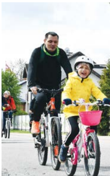
Jauno velomaršrutu Mārupieši iemēģināja 4.maijā

Turpinājumā plānots izstrādāt otru, līdzīgu maršrutu par Jaunmārupes un Skultes ciema teritorijām.