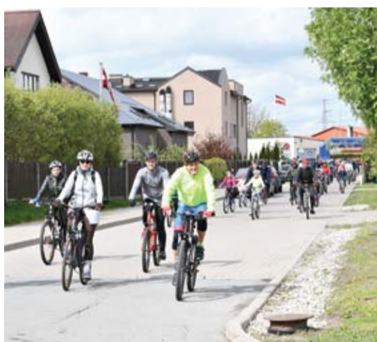
Aktīvā tūrisma sezona atklāta ar izziņošu velobraucieni "Senās novada mājas un varoņi"

Dienas izskaņā mārūpieši un viesi Mārupes Kultūras nama iekšpagalmā varēja baudīt leģendārās rokgrupas "Līvi" koncertu.