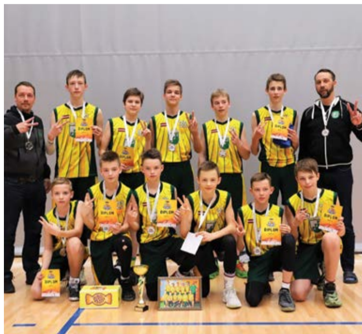
MSC U13 komanda ar treneriem – Latvijas republikas čempionāta sudraba medaļu ieguvēji