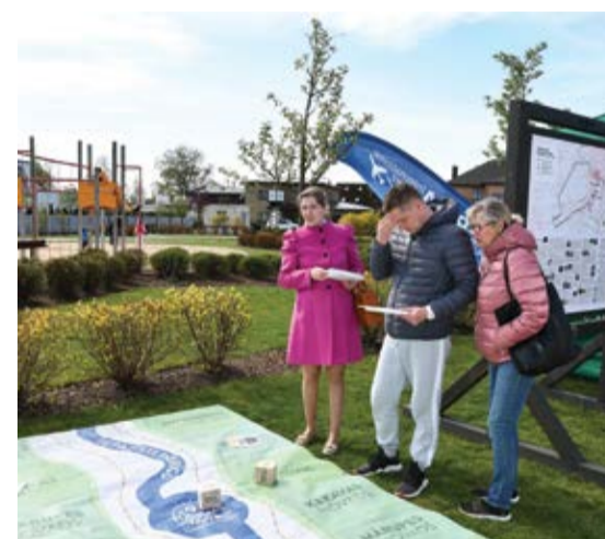
Svētku apmeklētāji pirmo reizi izmēģina Pierīgas novadu kopprojekta "Tūrisms kopā" ietvaros radīto spēli