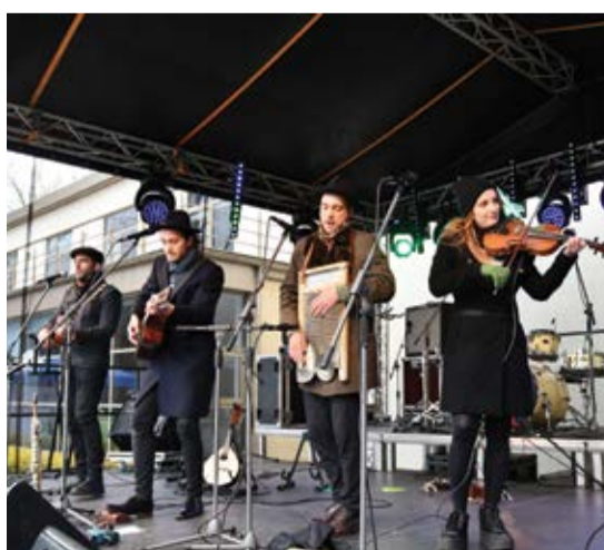
Tirdziņa apmeklētājus priecēja blūza grupa "Rahu The Fool"