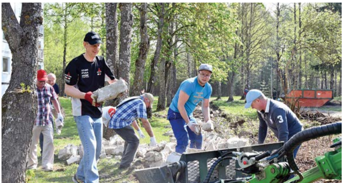
Vīros ir spēks! Tiek demontēta vecās sētas pamati Skultē

Rūpēsimies par savu apkārtni ik dienas un atcerēsimies – mēs pieredam nākotnei!