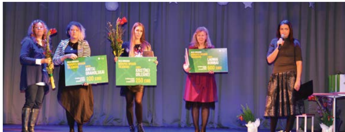
Sveikti labāko darbu autori – konkursa uzvarētāji

2018.gada vasarā Mārupes novada dome izsludināja ideju konkursu "Mārupes novada Talismans" ar mērķi iegūt iespējami labāko Mārupes novada raksturojošu personificēto tēlu – talismanu tēpa izveidošanai, kas būtu izmantojams Mārupes novada publiskajos pasākumos.