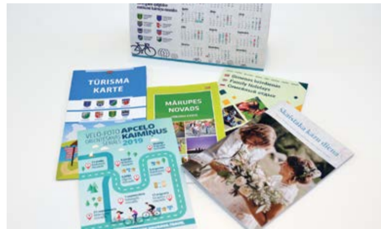
Izdoti jauni tūrisma materiāli, kas pieejami Mārupes novada pašvaldības iestādēs

Paldies, ka šajās izstādes dienās bijāt kopā ar mums!