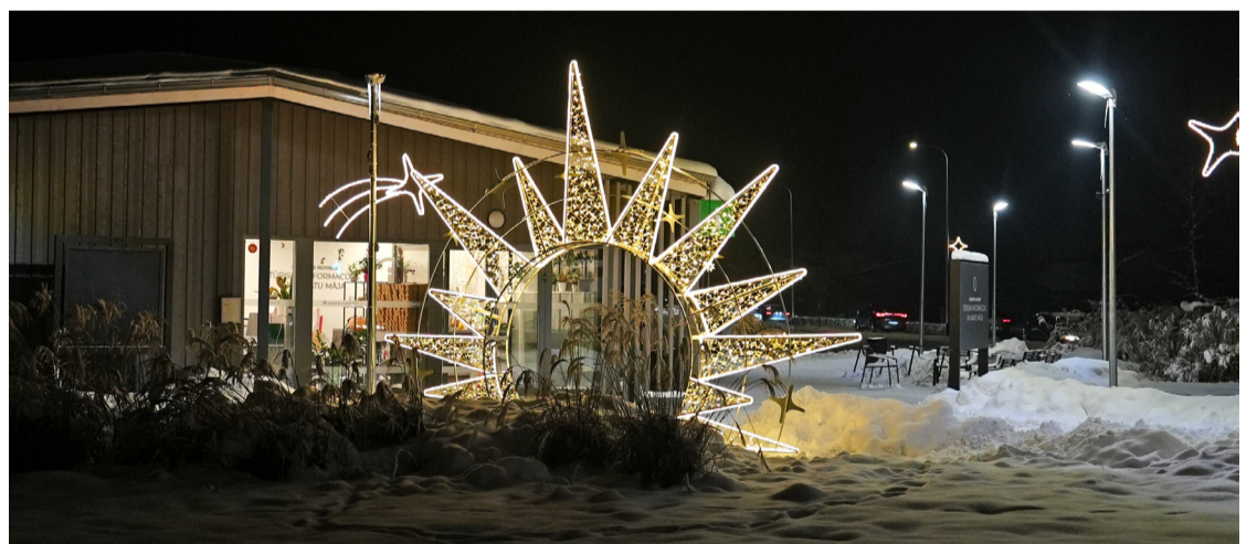
Svētku noformējums Mārupē.