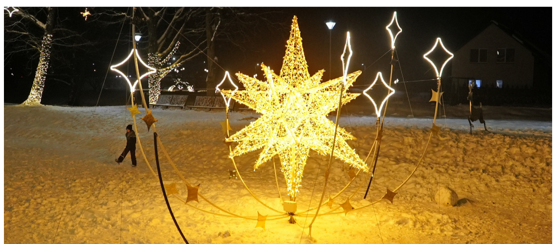
Svētku noformējums Jaunmārupē.