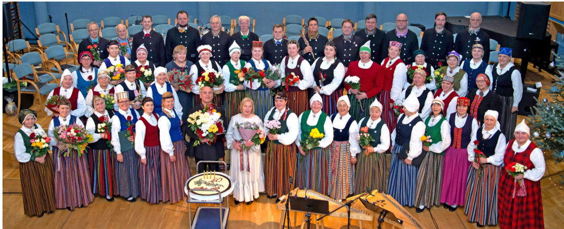
Jauktais koris "Atskaņa" 40 gadu jubilejas koncertā.