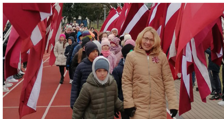
Valsts svētku pasākums Mārupes Valsts ģimnāzijā.

Mārupes Valsts ģimnāzija turpināja jau esošās tradīcijas un ieviesa jaunas. Mēnesi iesāka tradicionālais lāpu gājiens 11. novembrī. To turpināja patriotu nedēļa no 13. līdz 17. novembrim, kurā pamatskolas klasēs tematiskās stundas par Latvijas vēsturi vadīja 12. klašu skolēni. Patriotu nedēļā norisinājās arī īpašas nodarbības vairākās klašu grupās par Pirmo pasaules karu. Tāpat vidusskolas klašu grupās notika spēlfilmu "Mana brīvība" un