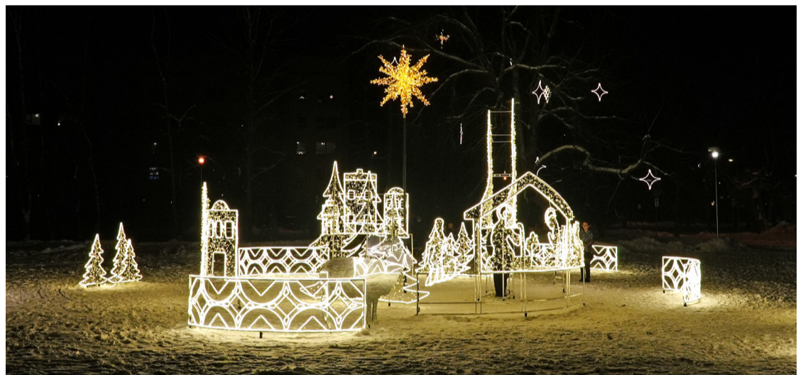
Svētku noformējums Piņķos.

Sabiedrības informēšanas un multimediju nodaļa