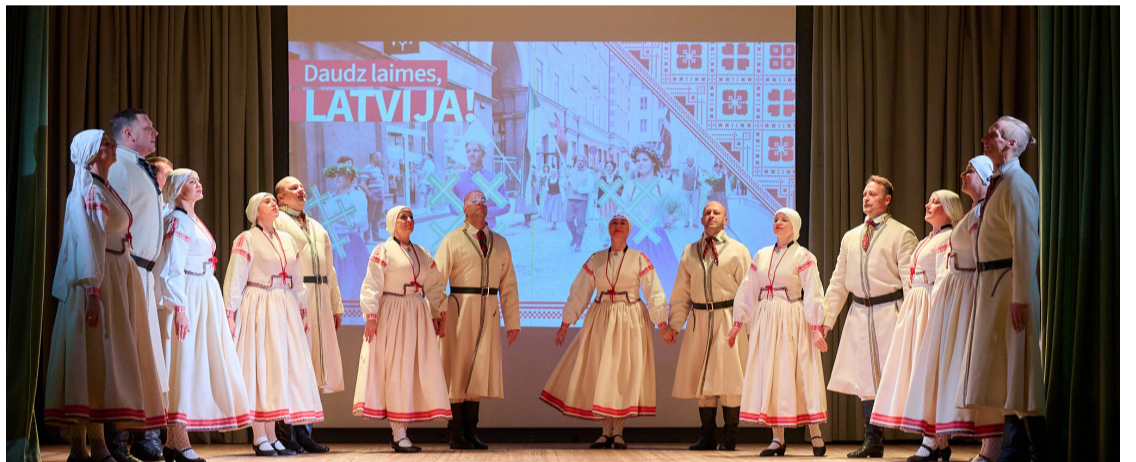
Vidējās paaudzes deju kolektīva "Mārupieši" priekšnesums Latvijas Republikas proklamēšanas 105. gadadienai veltītā pasākumā Mārupē.