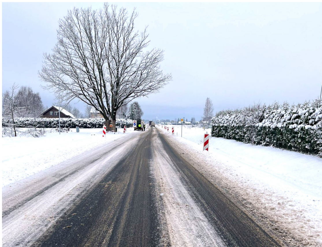
Autoceļš V-22 (Bašēni-Mežgali).

Sabiedrības informēšanas un multimediju nodaļa