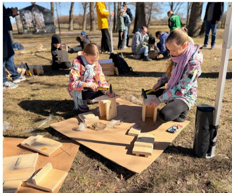
Putnu būru veidošana Jaunmārupē pie Švarcenieku muižas.

Tikšanās vieta – pie Beberbeķu ezera peldvietas (koordinātas 56°55'44.6"N 23°55'14.3"E).