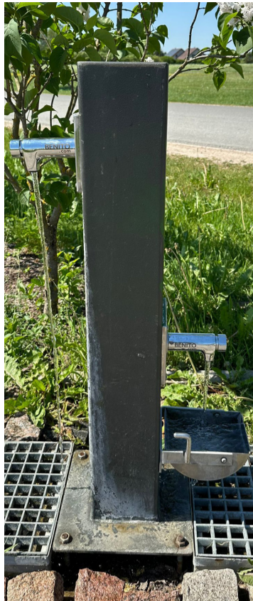
Brīvkrāns Mārupē, Rožu ielā.