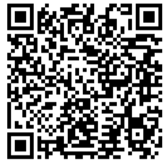
Mārupes Valsts ģimnāzija

Aptauju lūdzam aizpildīt līdz 2026. gada 8. maijam: