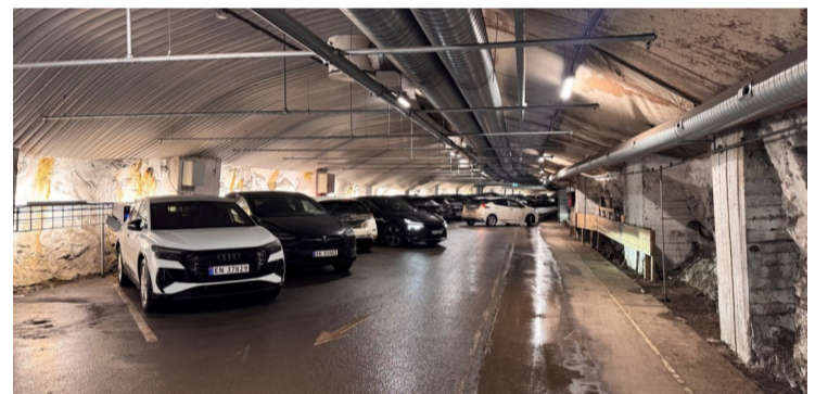
Cietoksni pazemē ierīkota stāvvietā, kas vienlaikus ir elektroauto uzlādes vieta un patvertne Oslo.

Savukārt pieredze, kas tika gūta Oslo, kurp februāra beigās devās Attīstības komitejas priekšsēdētāja vietnieks un Attīstības un plānošanas pārvaldes satiksmes plānotājs, apliecina, ka mūsdienīga mobilitāte balstās integrētā pieejā – vienotā transporta plānošanā, datu analītikā un ciešā sadarbībā starp publisko un privāto sektoru. Īpaši nozīmīgas atziņas gūtas par mobilitātes datu izmantošanu satiksmes plānošanā, autonomo transportlīdzekļu pilotprojektiem un transporta elektrifikāciju.