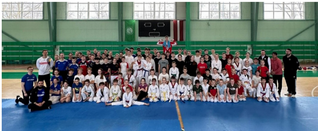
“Mārupes atklātais tekvondo kausis 2026” Mārupes novada Sporta skolā.

Apsveicam laureātus! Liels paldies visiem sportistiem, treneriem, ģimenēm un organizācijām par ieguldījumu sporta attīstībā novadā! Konkursos “Mārupes novada bērnu un jauniešu sporta laureāts 2025” un “Mārupes novada sporta laureāts 2025” kopumā tika saņemti vairāk nekā 200 pieteikumi, un tos izvērtēja komisija, kuras sastāvā bija Mārupes novada pašvaldības domes deputāti un Sporta un aktīvās atpūtas konsultatīvās padomes pārstāvji.