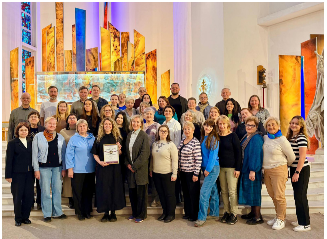
Jauktais koris "Atskaņa".