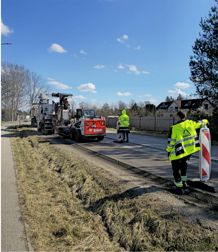
Kleistu ielas posma Babītes pagastā atjaunošanas darbu 2. kārtā.