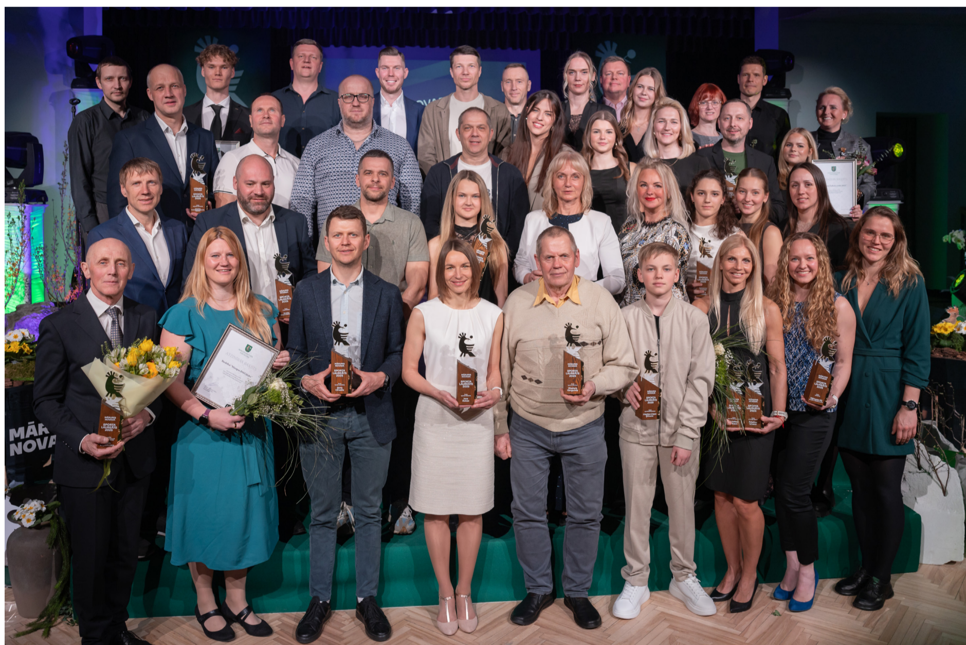
Konkursa "Mārupes novada sporta laureāts 2025" uzvarētāji.

SVEICAM LATVIJAS REPUBLIKAS NEATKARĪBAS ATJAUNOŠANAS DIENĀ!