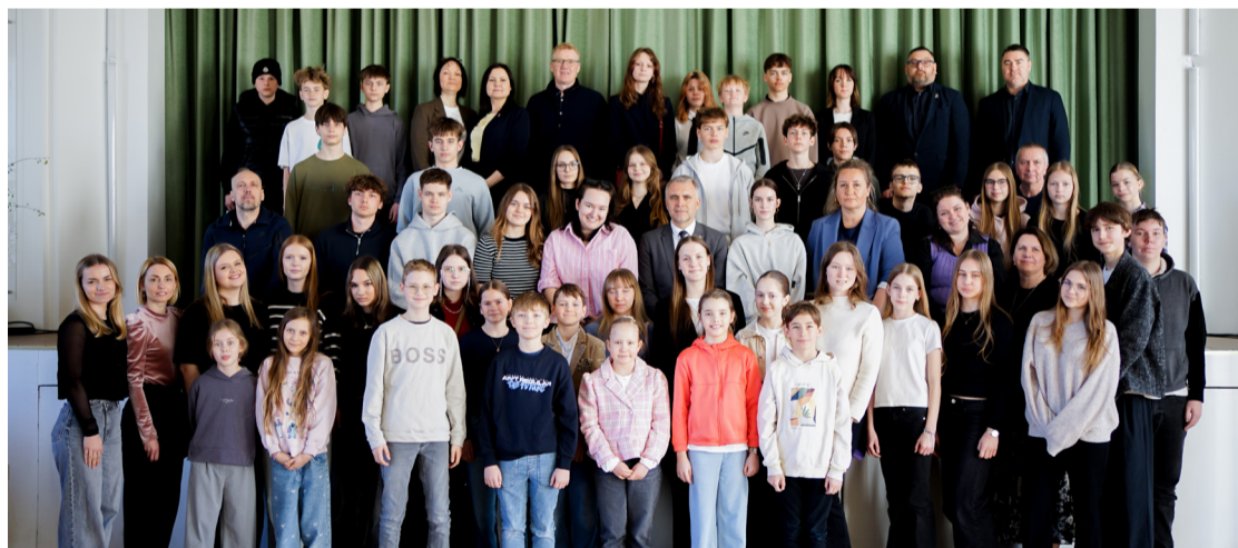
Ēnu dienas dalībnieki.