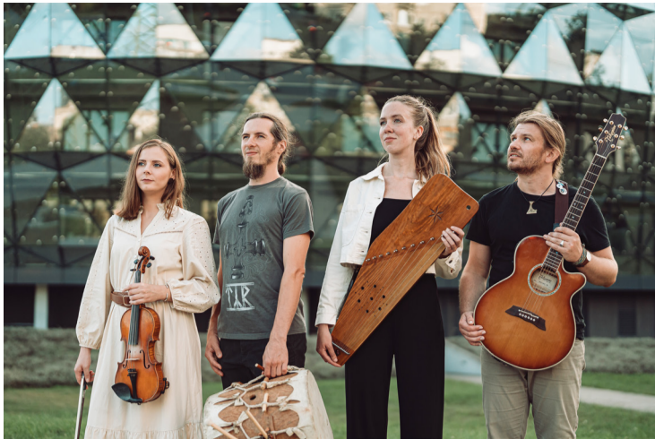
GRUPAS “JŌRA” PUBLICITĀTES FOTO.

Plkst. 20.00 notiks tradicionālā Muzeju nakts komandu erudīcijas