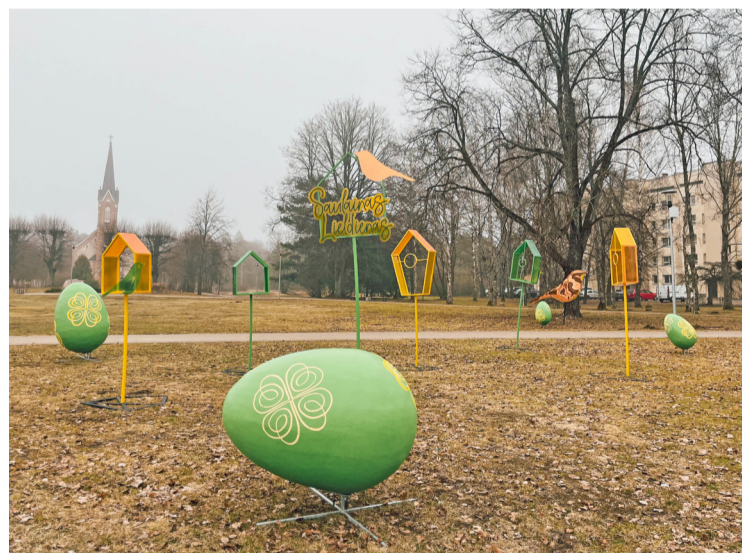
Lieldienu vides noformējums.