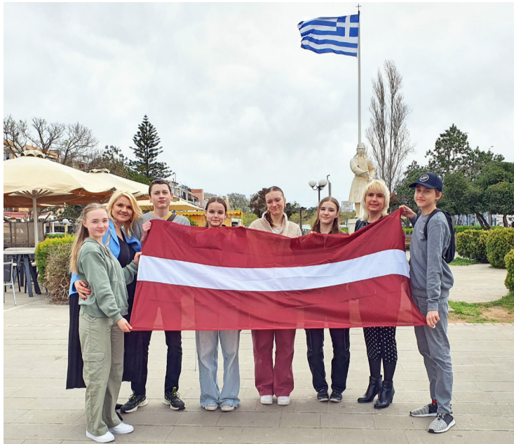
Vides projekta dalībnieki vizītē Grieķijā.

No 25. līdz 29. martam Jaunmārupes pamatskolas seši skolēni un divi skolotāji piedalījās “Erasmus+” projekta “Climate Actions starts from Local Level” (Eiropas Savienības “Erasmus+” programmas pamatdarbības KA229 skolu apmaiņas partnerību projekts Nr. 2023-1-RO01-KA220-SCH-000154832) vizītē