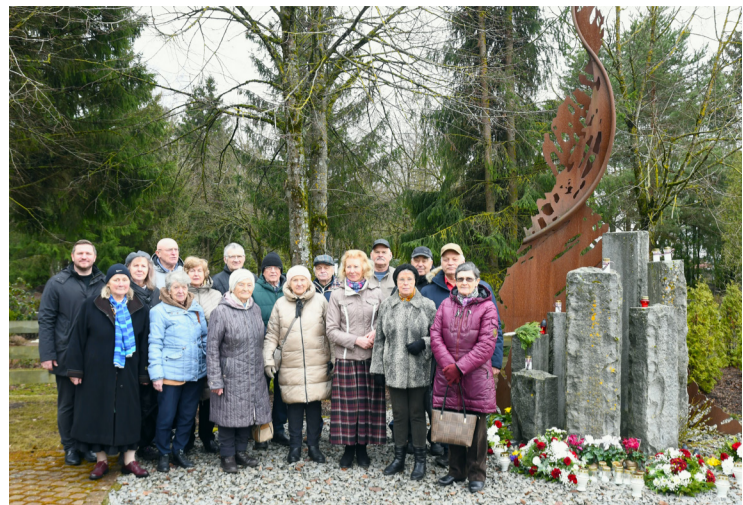
Piemīņas pasākuma dalībnieku kopbilde.

Sabiedrības informēšanas un multimediju nodaļa