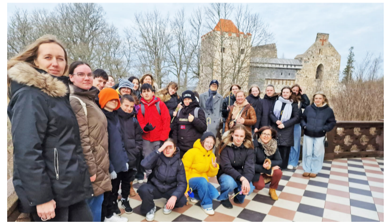
Projekta dalībnieku vizīte Siguldas pilī.