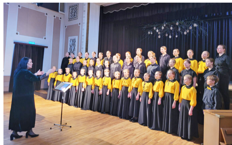
Jaunmārupes pamatskolas koris skatē Baložu Kultūras namā.

Sirsnīgi sveicam visus mūsu skolu kolektīvus ar augstajiem rezultātiem un iekļūšanu konkursa otrajā kārtā! Paldies koru diriģentiem, vadītājiem un koncertmeistariem! Paldies arī ģimenēm par atbalstu!