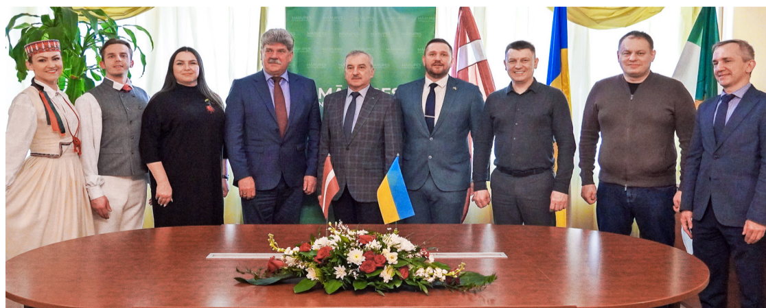
Mārupes novada pašvaldības un Veļika Berezovicjas pašvaldības pārstāvji līguma parakstīšanas dienā.

starp abām pašvaldībām turpmākam darbam miera, attīstības, atbalsta un vietējās demokrātijas stiprināšanas virzienos. Līguma ietvaros plānots veicināt pieredzes apmaiņu ekonomikas, izglītības, kultūras,