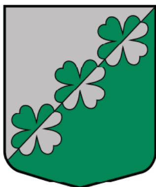
Mārupes pagasta ģerboņa krāsainā versija