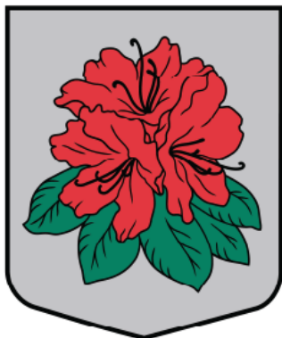
Babītes pagasta ģerboņa krāsainā versija