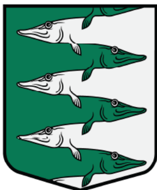
Salas pagasta ģerboņa krāsainā versija