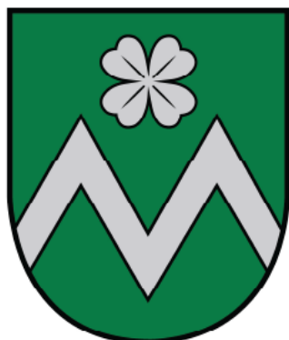
Mārupes pilsētas ģerboņa krāsainā versija