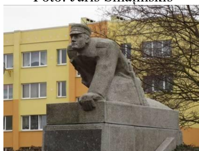
Latvijas Brīvības cīņu Piņķu kaujas piemineklis