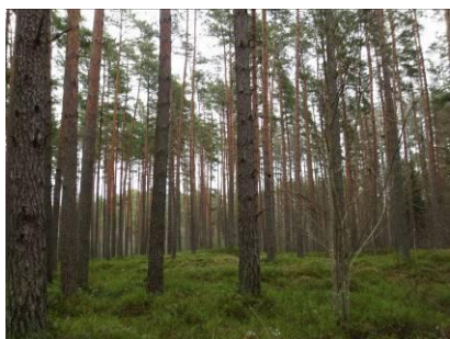
Priežu meži Božu ūdenskrātuves apkārtnē