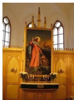
Piņķu baznīcas altārglezna