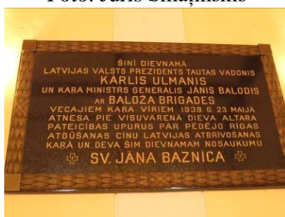
Piemiņas plāksne Piņķu luterāņu baznīcā