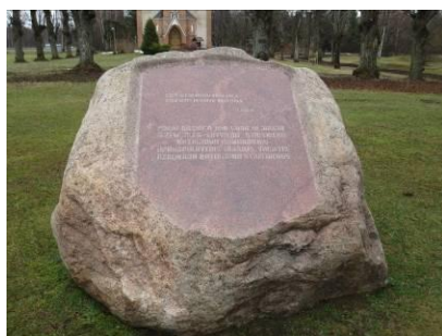
Piemiņas akmens latviešu strēlniekiem