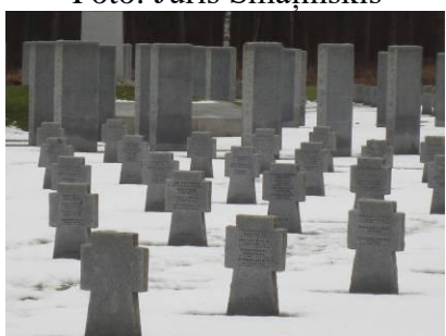
Beberbeķu vācu kapi