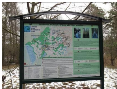
Informācijas stends Mārupes novadā