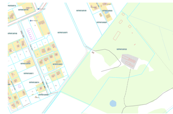
Objekta Izvietojuma shēma