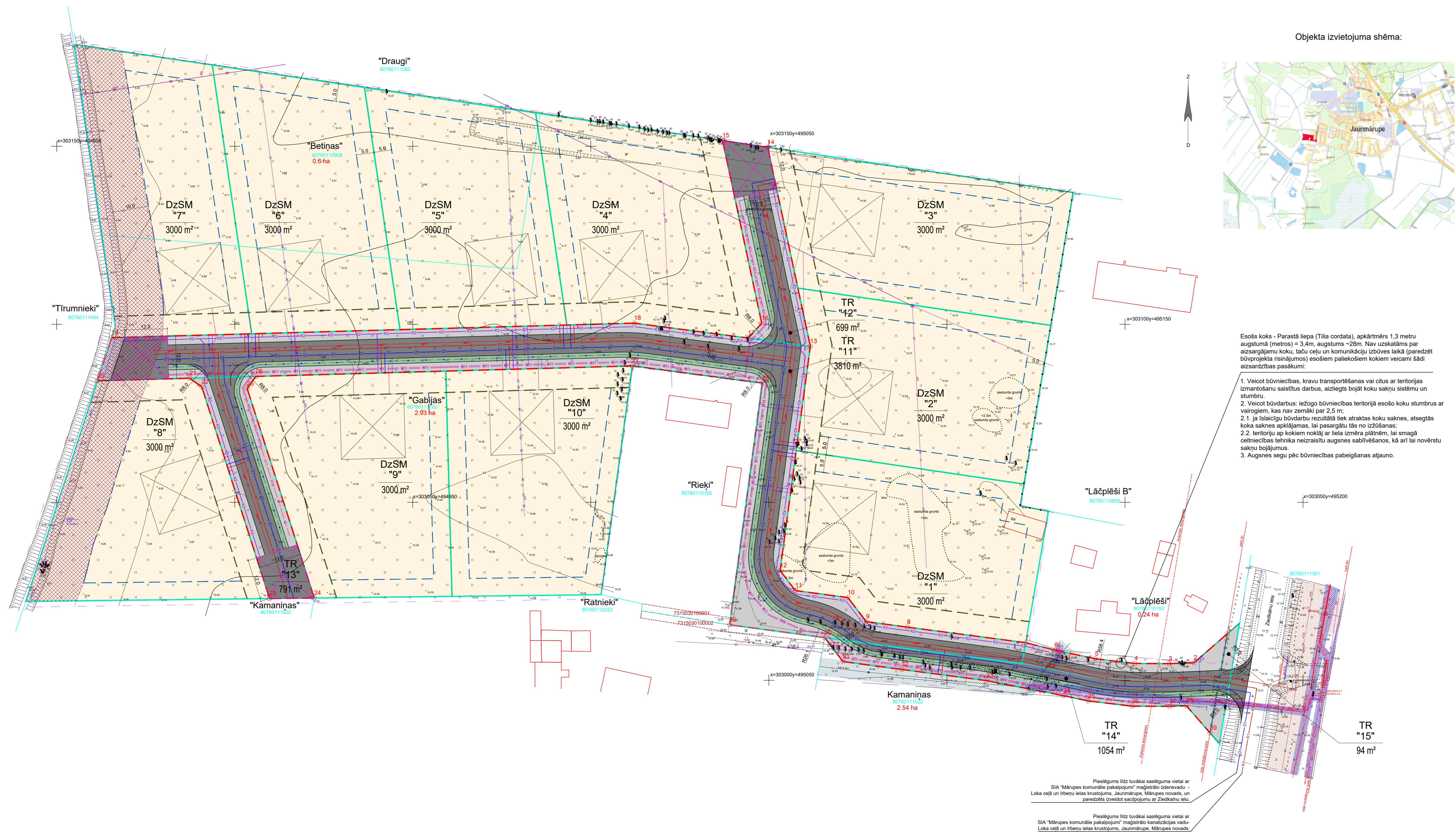
Objekta izvietojuma shēma: