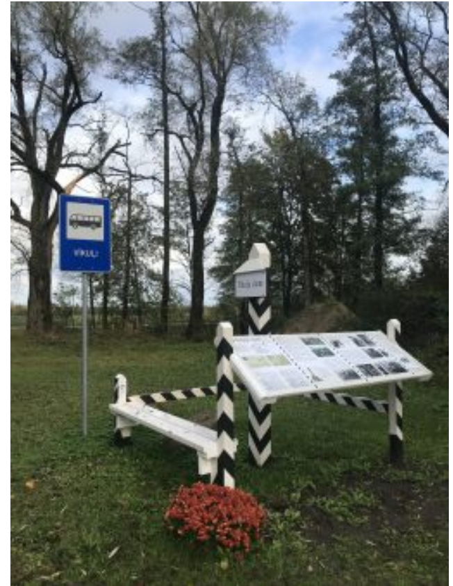
Foto: Verstu stabs Vīkuļu ciemā