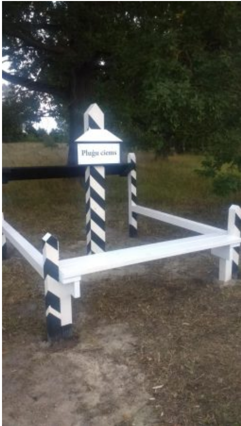
Foto: Verstu stabs Plūgu ciemā