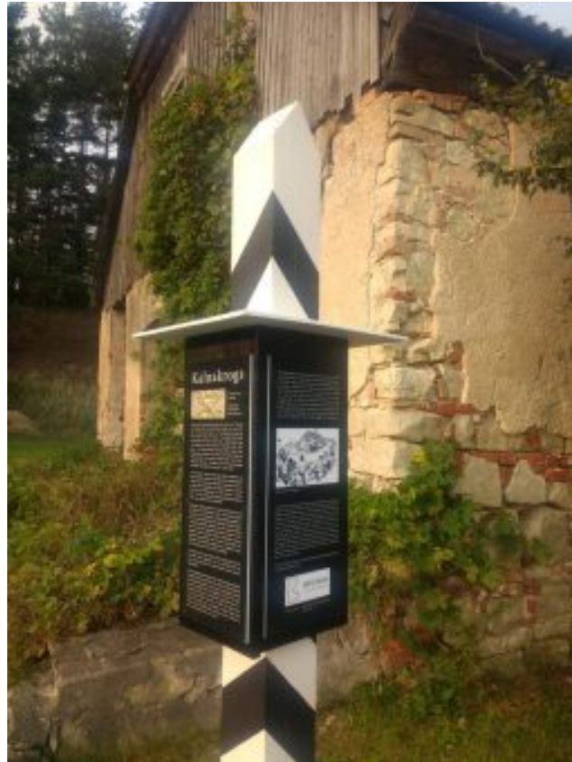
Foto: Verstu stabs pie Kalnakroga Brīvkalnos