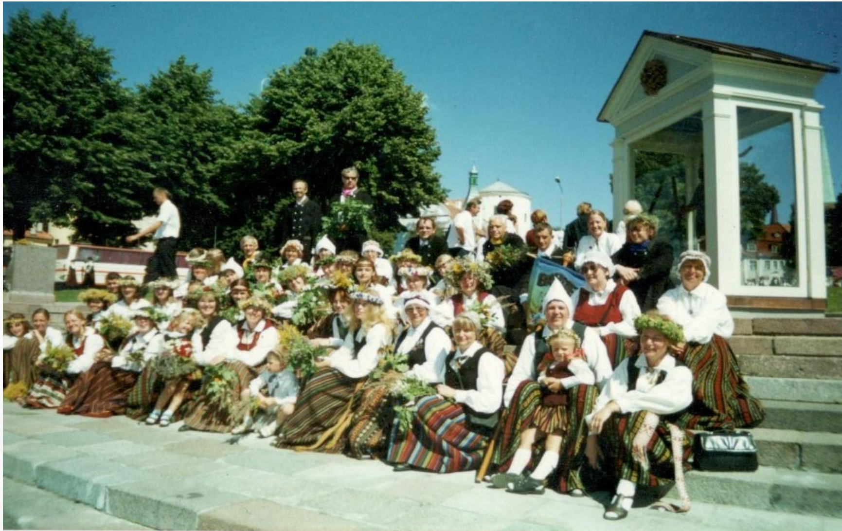
Dziesmu svētkos, 1998.gads