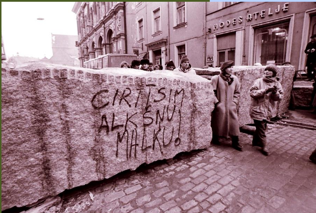
Foto: Ilgvars Gradovskis Foto no 1991. gada barikāžu muzeja krājuma.