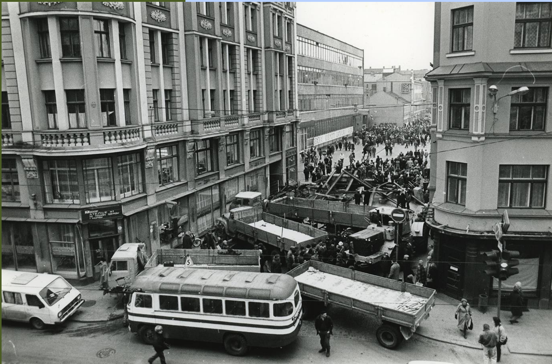
Dzirnavu iela pie Tālsatiksmes telefonu centrāles. 1991. gada janvāris