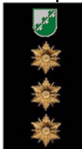
I pakāpe Policijas priekšnieks