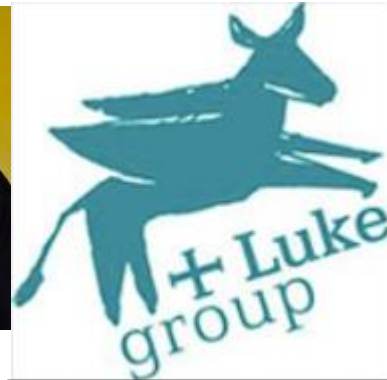
Svētā Lūkasa darbnīca