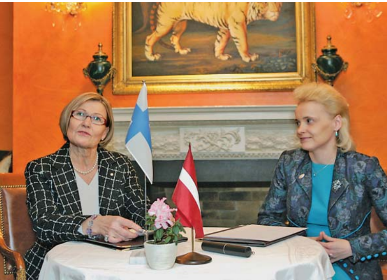
Biedrība Līdere paraksta sadarbības līgumu ar Somijas Sieviešu uzņēmēju aģentūru, pārņemot mentoringa metodoloģiju.