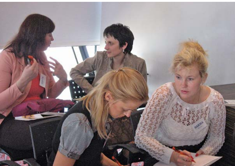
Biedrības Līdere mentoringa programmas uzsākšanas seminārs. Pieredzes pārņēmēju pirmā tikšanās reize ar mentoriem.