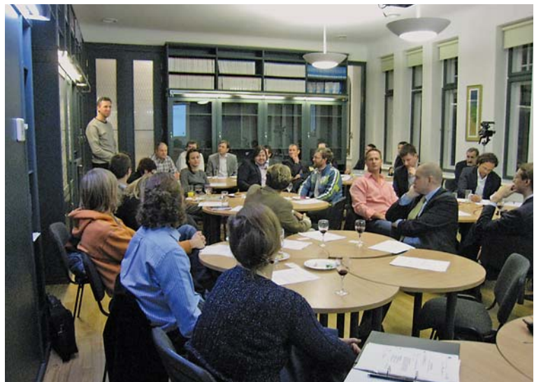
REA Mentorų kluba pasākums – mentorų diskusija par uzņēmējdarbības aktuālajām problēmām un attīstības iespējām Latvijā.

kas vēl jāsasniedz, kā arī diskutē par iemesliem, kāpēc kaut kas nenotiek, kā iepriekš bija plānots.