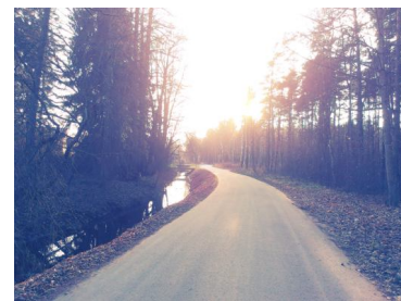
Mārupīte Mārupes novadā, Mārupītes gatvē pie Medemu purva