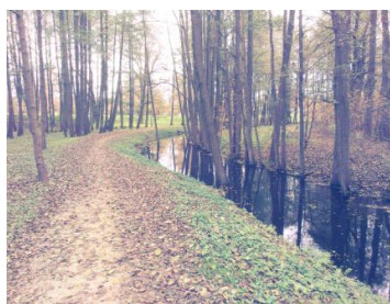
Mārupīte Rīgas pilsētas teritorijā, Mārupītes dabas parkā

Tālāk maršruts visā garumā līdz Māras dīķim ved gar Mārupīti. Laika gaitā Mārupītes gultne ir piedzīvojusi daudz pārmaiņu, cilvēks vienmēr ir centies to pieskaņot savām vajadzībām, taču tās tecējums nav zudis. Mārupīte ir iedvesmojusi daudzus māksliniekus un savā ziņā tā ir veidojusi tagadējo Mārupes novadu. Mārupīte ir Daugavas kreisā krasta pieteka. Tā iztek no Medema purva rietumu daļas (Mārupes novadā) un ietek Daugavā (Rīgas pilsētas teritorijā). Upes kopējais garums ir 11 km, baseina laukums - 35,5 km 2 . Tā kā Mārupīte tek pa līdzenu reljefu, upes relatīvais kritums ir ļoti neliels - tikai 15 m. Novada teritorijā upes gultne ir iztaisnota.