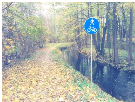
Mārupīte veloceliņš tā sākumpunktā pie Dauguļu ielas

Mārupītes darba parks atrodas Rīgas pilsētas daļā, Bierīņu apkaimē. Mārupītes dabas parks ietver Mārupīti posmā no Dauguļu ielas līdz Māras dīķim. Teritoriju pārsvarā veido slapji melnalkšņu meži. Mārupītes dabas parkā ir ierīkots Mārupītes veloceliņš, kas ved līdz Māras dīķim, kā arī apskatāma Bierīņu muiža un akmens skulptūru dārzs.