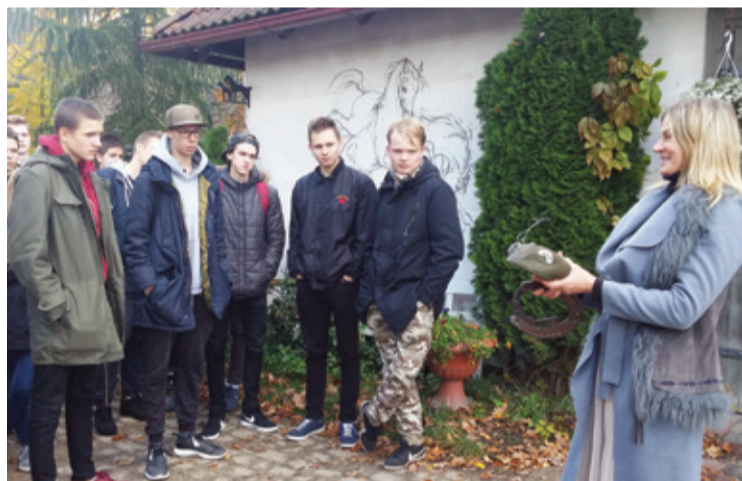
Zirgu stalli "Zirgzandales" jaunieši iepazīst zirkopja, zirgu trenera un jātnieku trenera profesijas.

Liels paldies biedrībai "Mārupes uzņēmēji", par labo sadarbību, un Mārupes novada izglītības iestāžu skolēnu nodrošināšanu ar transportu mācību ekskursijām, un visiem