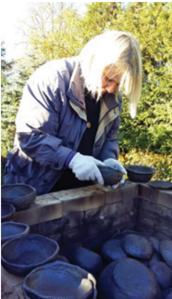
Tiek iemēģināts jaunais ceplis.