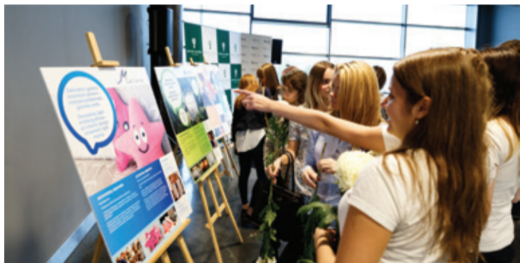
Mārupes novada Uzņēmēju dienu ietvaros atklāta Mārupes vidusskolas skolēnu mācību uzņēmumu produktu izstāde lidostas "Rīga" terminālī.