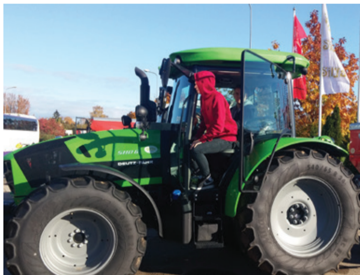
Uzņēmumā "Silja" skolēniem vislielākā interese bija par smago lauksaimniecības tehniku.

mu AS "Olainfarm", apskatīt centrālo laboratoriju, eksperimentālo iecirkni, uzzināt par Latvijas aptieku darbu, kā arī par ķīmiķa, zāļu reģistrācijas speciālista, tehnologa un farmaceita profesiju.