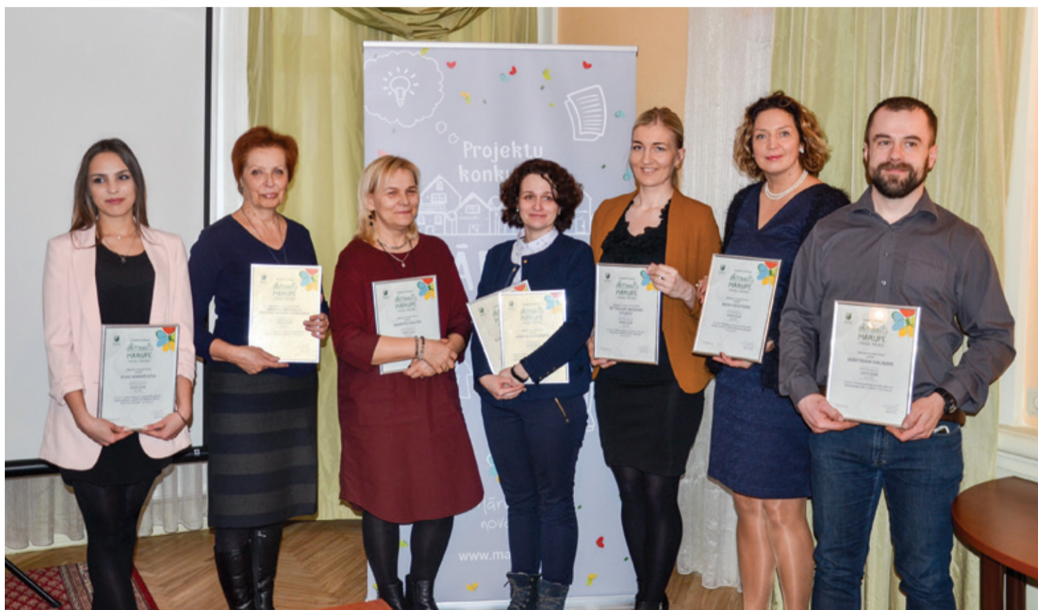
Mārupes pašvaldība projektu konkursu “Mārupe – Mūsu mājas” rīko jau trešo gadu pēc kārtas un ar katru gadu pieaug projektu iesniedzēju skaits. Šogad pašvaldība piešķirusi finansējumu jau deviņu projektu īstenošanai.