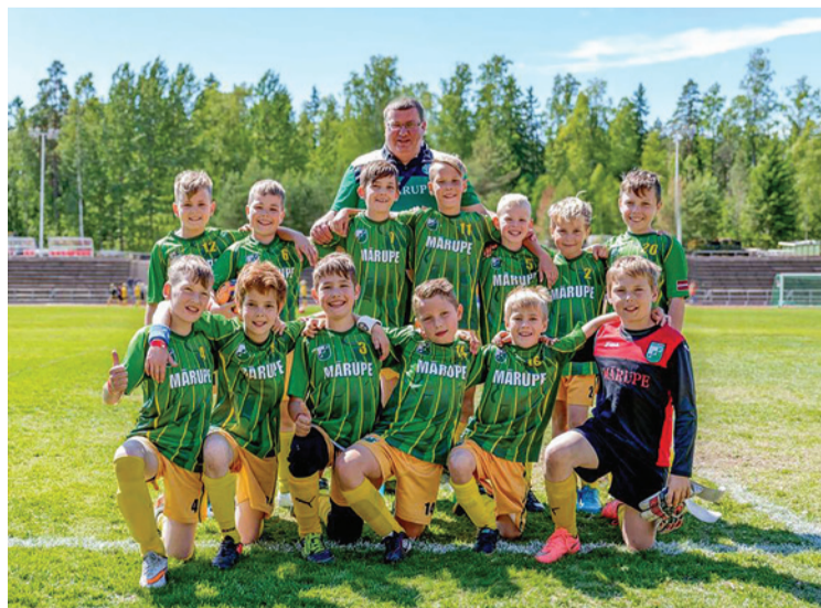
Mārupes Sporta centra futbolisti Somijā