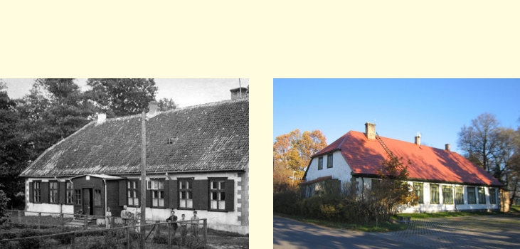
Švarcekmuiža senāk/ Schwarceck manor before

Vienlaikus ar blakus muižai esošās Jaunmārupes sākumskolas būvniecību arī vecā ēka ieguvusi skaidi sakārtotu un izkoptu teritoriju. Pārdodot namu novēlēts izmantot izglītības mērķiem. 1910.-1971. gadam ēkā atradās Mazcenas pamatskola, bet vēlāk tika iekārtota bibliotēka. Otrā Pasaules kara laikā muiža kalpojusi kā hospitālis. Saimniecības ēkas no muižas apbūves nav vairs saglabājušās, tikai varenas egles un diķīts, kā liecība par muižas dārzu. No sākotnējā interjera ir saglabājušās tikai kāpnes uz otro stāvu. Šobrīd ēkā darbojas Mārupes pašvaldības dienas centrs un jauniešiem „Švarcenieki”.