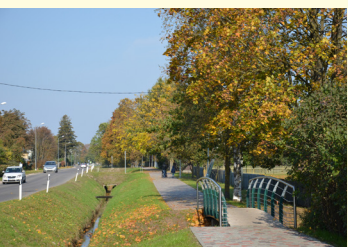
Mazupīte Mārupīte / Small river Mārupīte

Historical name: River by the priests house Source: Cenu mire Mouth: Babīte lake (56°56'31″N 23°50'59″E) Length: 13 km (regulated length 8,9km) Basin: 51 km²