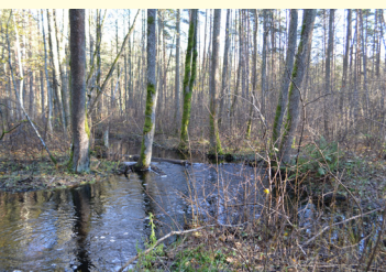
Mazupīte Dzilnupe / Small river Dzilnupe