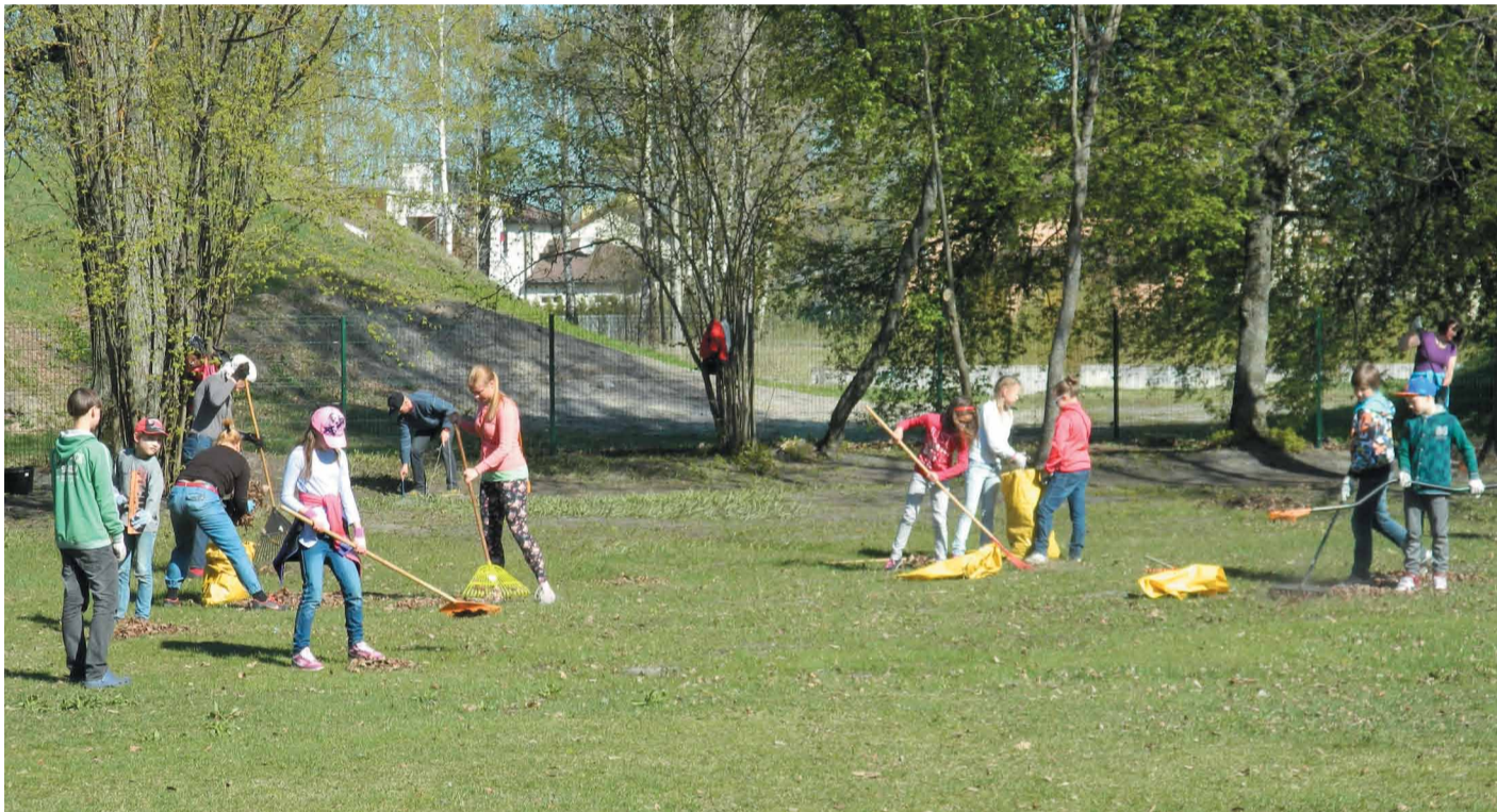
Mārupes vidusskolas teritorijā tika savāktas gan pērnās lapas, gan atjaunoti parka celiņi

26.aprīļa Lielaajā Talkā Mārupes novadā čakli laudis rosījās divdesmit talku vietās. Laika apstākļi bija jauki un padarītie darbi – ievērojami.