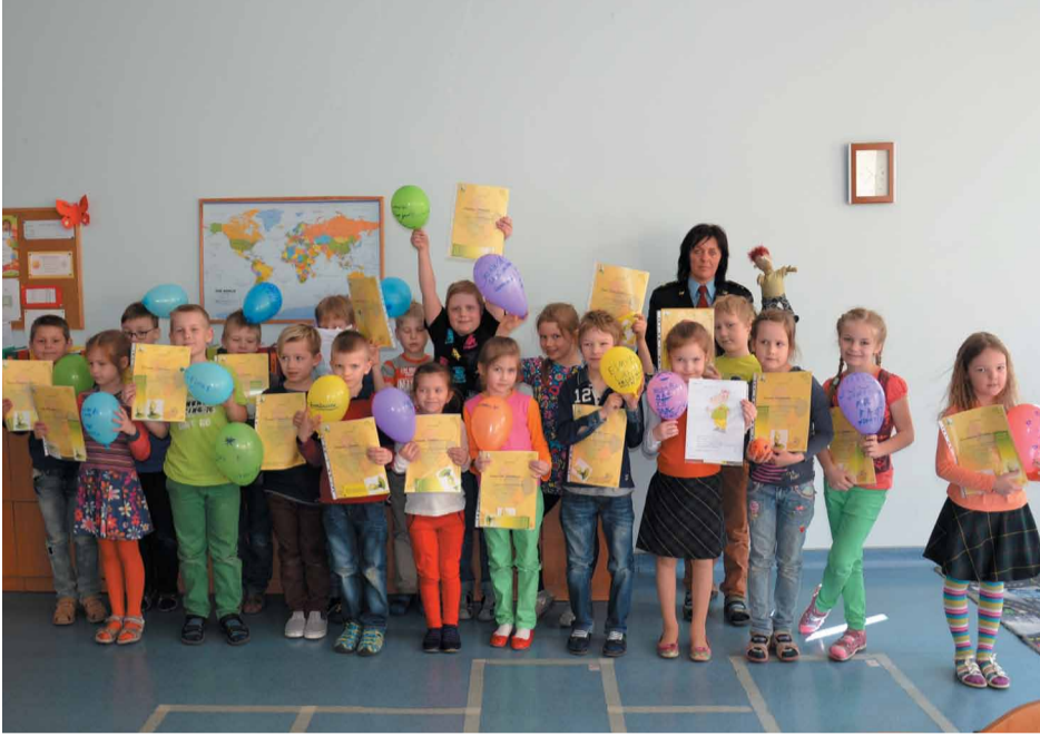
Noslēdzoties apmācību programmai, katrs bērns saņēma Džimbas apliecību, kā arī mazas dāvanīņas

Ar jautru un atraktīvu nodarbību Jaunmārupes sākumskolas 1.a klasē 24.aprīlī noslēdzās Džimbas 9 soļu drošības programma, kas visas mācību sezonas garumā norisinājās vairākās Mārupes novada izglītības iestādēs. Šo nodarbību mērķis ir, izglītojot pirmsskolas un jaunākā skolas vecuma bērnus, mazināt vardarbības risku bērnu dzīvē.