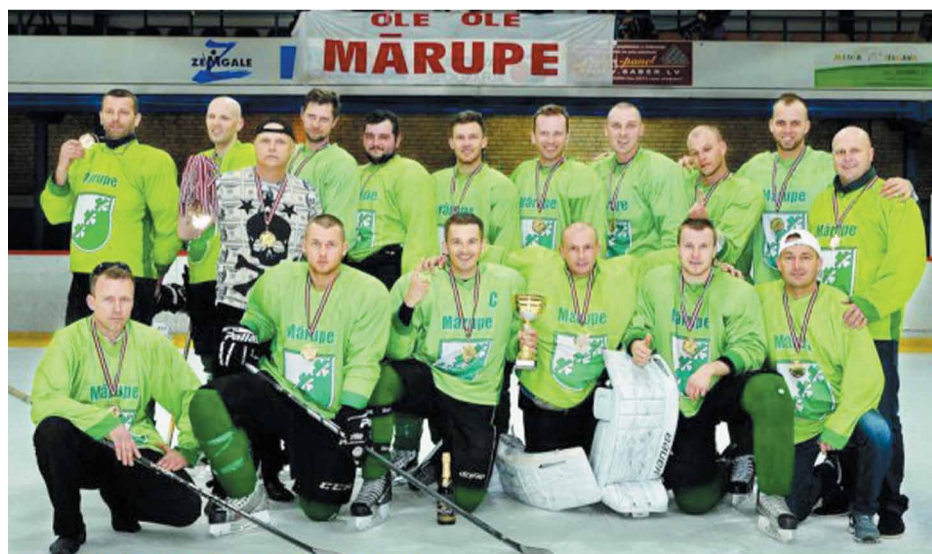
Z AHL uzvaras kauss iegūts jau otro gadu pēc kārtas