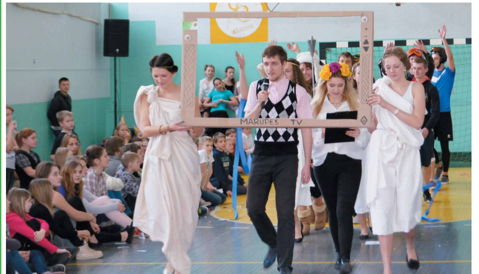
Azartiskas un atraktīvas bija 12.a klases atveidotās Olimpiskās spēles

Pirms Lieldienām Mārupes vidusskolā noslēdzās gadskārtējās Mākslas dienas. Šogad tās caurvija divas tēmas – Lieldienas un Svētki.