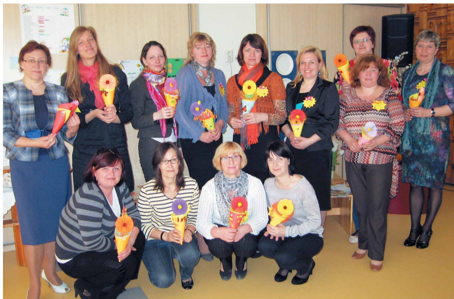
Pierīgas PII skolotājas pieredzes apmaiņā par pedagogu un vecāku sadarbības lomu bērna personības attīstīšanā

Trīs un četrgadīgie bērni savas tēmas apguvē kā galveno darbības veidu izmantoja rotaļu. Piemēram, grupas „Lācīši” tēma bija „Lielā pārgērbšanās” ar mērķi sniegt bērniem priekšstatu par cilvēku apģērbu. Vecāki izdomāja tērpu, kādā uz pasākumu ieradīsies bērns. Pasākumā katrs bērns demonstrēja