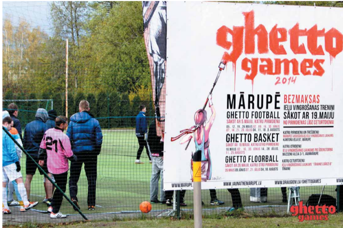
„Ghetto Football 6:6” dalībnieki šovasar cīnīsies par Mārupes čempionu titulu

Latvijas ielu sporta dzīves vadošās kustības „Ghetto Games” aktivitātes šovasar katru pirmdienu notiek tieši Mārupē, Kantora ielā 97, dodot iespēju gan vietējiem iedzīvotājiem, gan ciemiņiem izbaudīt azartiskas cīņas trijos sporta veidos.