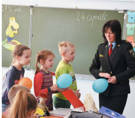
Noslēguma nodarbībā bērniem tika izdalīti baloni, uz kuriem katrs uzrakstīja, viņaprāt, divus svarīgākos noteikumus