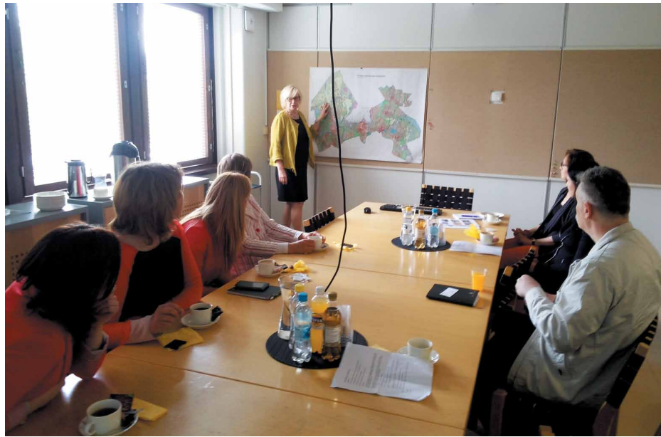
Domes pārstāvjiem bija iespēja tikties ar vairākiem Vantaa Attīstības un plānošanas nodaļas speciālistiem, kuru pieredze vides, lidostas un pašvaldības attīstības plānošanā ir gūta ilgā laika periodā