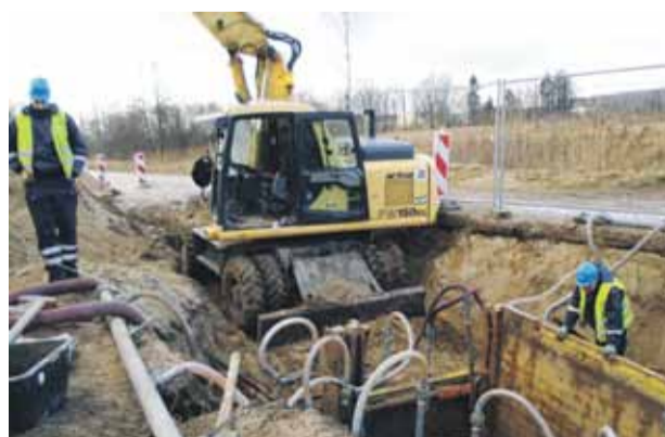
Tiek īstenots ES KF projekts „Ūdenssaimniecības pakalpojumu attīstība Mārupē”