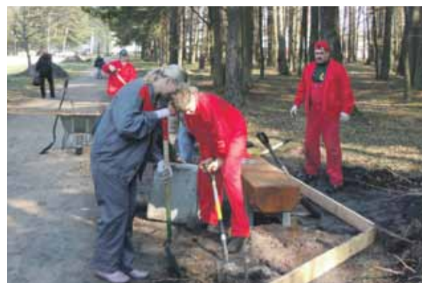
Mārupieši piedalās „Lielajā Talkā”