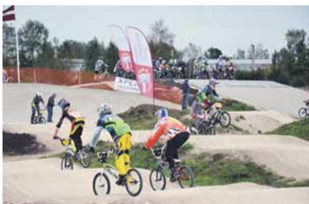
Atvērta Mārupes BMX trase