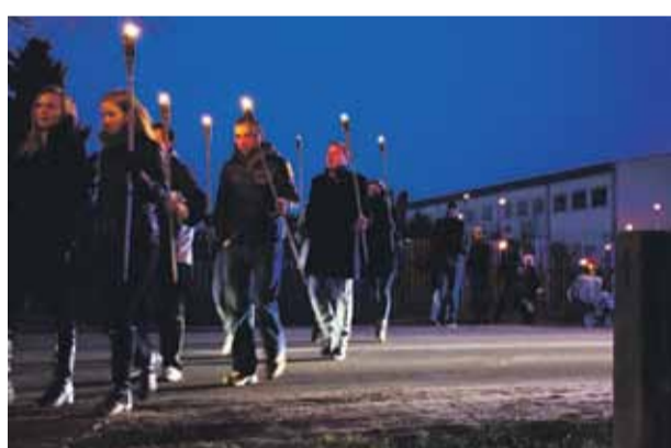
11. novembrī atzīmējam ar lāpu skrējieni un gājienu