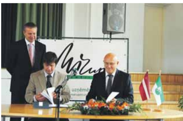
Mārupes novada Dome paraksta vienošanos par sadarbību ar biedrību „Mārupes uzņēmēji”