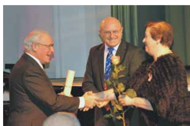
18. novembrī godinām mārupiešus par ieguldījumu novada saimnieciskās un sabiedriskās dzīves veidošanā