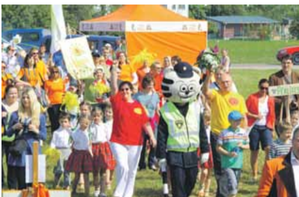
Maijā svinam „Bērnu svētkus”