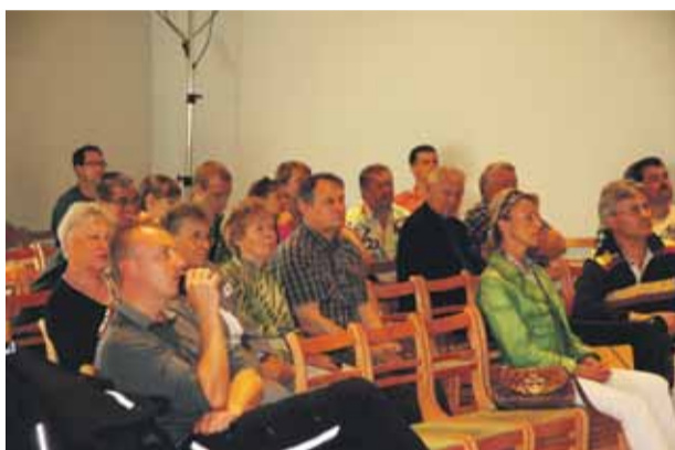
Par Mārupes novada attīstību spriežam publiskajās apspriedēs