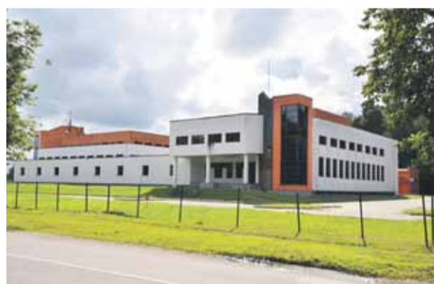
Izglītības vajadzībām pašvaldība iegādājas īpašumu Mazzenu alejā