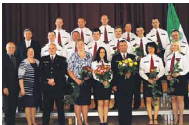
1. janvārī darbu uzsāk Mārupes novada Pašvaldības policija