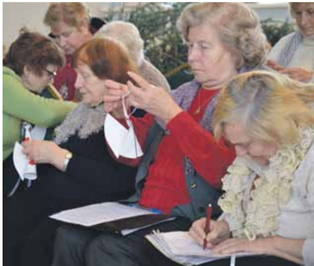
Enģeļu rotas darina senioru kora „Noktirne” dalībnieces

Pirms Ziemassvētku laikā, kad miers virs zemes un cilvēkiem labs prāts, sirsniģi un ģimeniski adventes koncerti notika viesmīlīgajās Mārupes Kultūras nama telpās.