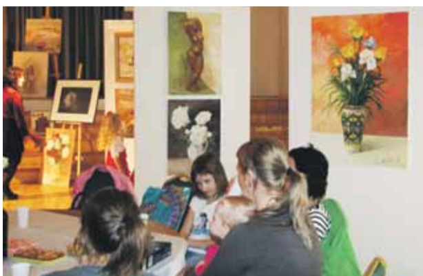
Pavasārī rīkojam „Mākslas dienu”