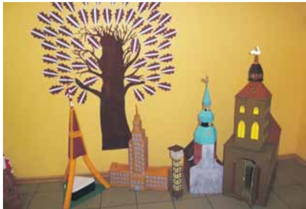
Mārupes novada Skultes sākumskolas akcijas darbi

Latvijas valsts svētkiem veltītā latviešu tautas vēstures un kultūras dekādē „Latvija – mana dzimtene” Skultes sākumskolā šogad patiešām bija notikumiem pārbagāta un ar patiesas brīvības dvesmu. Pasākumi mijās viens ar citu, un katru dienu bērniem tika piedāvāts kaut kas jauns, līdz šim nebijis.