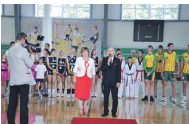
Svinīgi tiek atvērts Mārupes Sporta komplekss