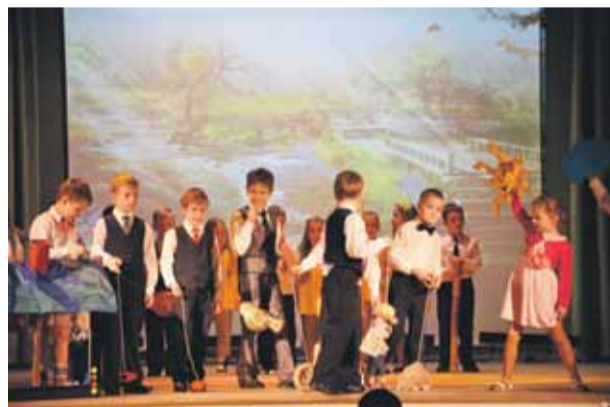
Svētku koncerta laikā bērni rāda teatrālu uzvedumu

Daudz kas no sasniegtā ir bērnudārza kolektīva nopelns, tāpēc pateicības vārdi par ilggadīgu darbu svētku pasākumā tika teikti bērnudārza bijušajiem un esošajiem