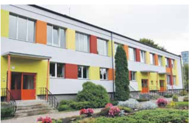
Renovēts Mārupes vecākais bērnudārzs „Lienīte”