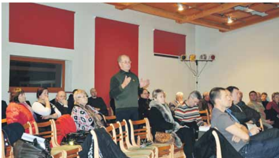
Turpinājums no 1.lpp.

Pamatojoties uz iedzīvotāju lūgumiem un apkopojot spēkā esošā Mārupes novada teritorijas plānojuma realizācijas problēmas, Mārupes novada teritorijā piedāvāts veidot atsevišķi nodalītas dzīvojamās un atsevišķi nodalītas publiskās darījumu un ražošanas darījumu teritorijas, nepielietojot jauktu dzīvojamo un darījuma teritoriju funkcionālo zonējumu. Skaidri nodalīts teritorijas funkcionālais zonējums ļaus veidot katrai izmantošanai atbilstošu dzīves vidi un tālākā novada attīstībā tiks samazināts dzīvojamo teritoriju un darījuma teritoriju izmantošanas konflikts.