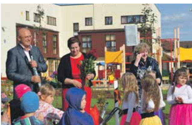
Atklājam publisko skvēru Konrādu ielā