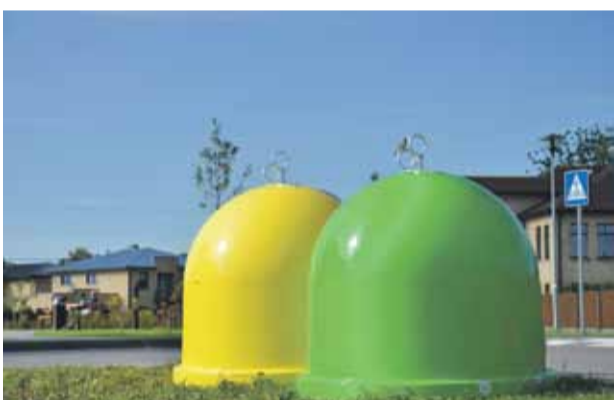
Sākam šķirot atkritumus