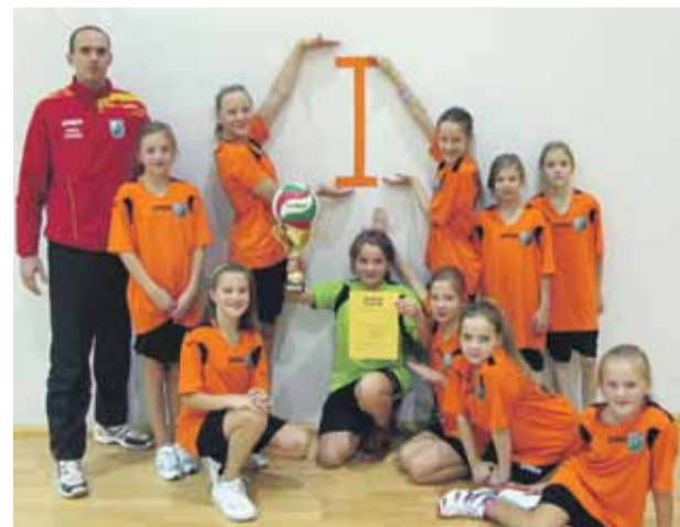
Jaunmārupes sākumskolas meiteņu komanda iegūst 1.vietu