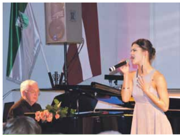
Pārsteiguma sveicienu klātesošajiem sagādāja maestro Raimonds Pauls

Patīkamas gaisotnes un labestības caurstrāvots bija Latvijas Republikas proklamēšanas 94. gadadienai veltītais sarīkojums 18.novembrī Mārupes Kultūras namā.