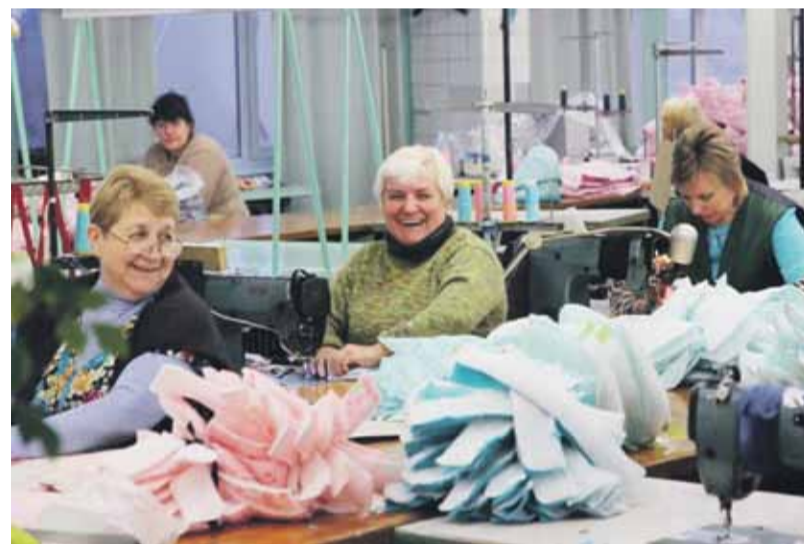
Delegācijas pārstāvji apmeklēja lina apstrādes un ražošanas rūpnīcu

No Silvestra Savicka un Pētera Pikšes iesniegtās informācijas un fotogrāfijām materiālu sagatavoja Uva Bērziņa.