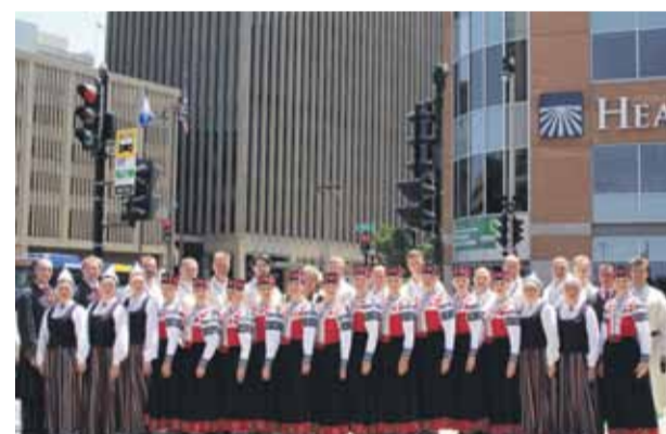
Deju kolektīvs „Mārupieši” pārstāv Latviju XIII ASV latviešu dziesmu un deju svētkos