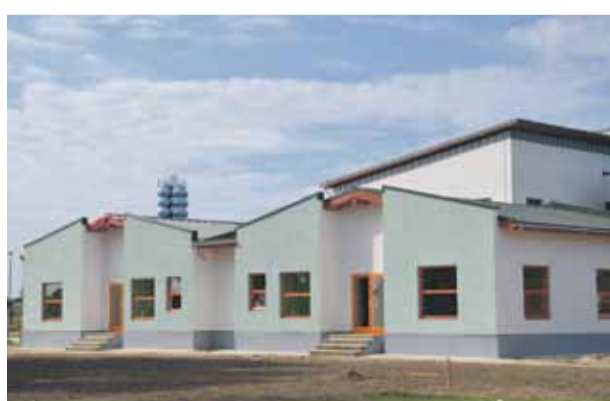
Uzcelta piebūve Jaunmārupes pamatskolai, rodot papildus vietu 48 bērnudārza vecuma bērniem