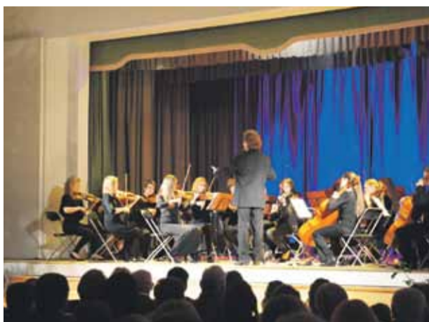
Jāzepa Mediņa Rīgas 1. mūzikas skolas kamerorķestris „Armonico”

16. decembrī, notika koncerts „Baltais Adventes laiks”, kurā svētku noskaņu raisīja kori „Noktirne”, „Mārupe”, „Resono” un ansambļi „Mazās sirdis” un „Dzelde”. Atbalstot Vislatvijas pilsētu akciju „Enģeļi pār Latviju”, adventes koncertā tika iedegta arī Mārupes Enģeļu egle. Gatavojoties koncertam, enģeļu rotas savās nodarbībās bija darinājuši senioru kora „Noktirne”, jautkā kora