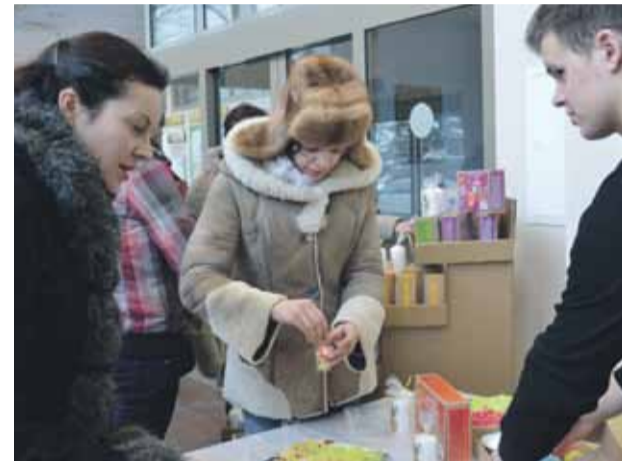
Ziemassvētku tirdziņa apmeklētāji piedalās sveču darbnīcā

16. decembrī Mārupes Kultūras nama iekšpagalmā un vestibīlā notika arī Tradicionālais Ziemassvētku tirdziņš.