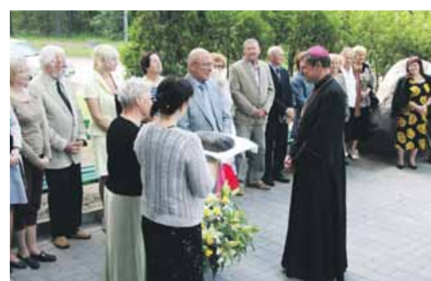
Mārupē pirmo reizi viesojas Rīgas arhibīskaps metropolīts Zbigņevs Stankevičs