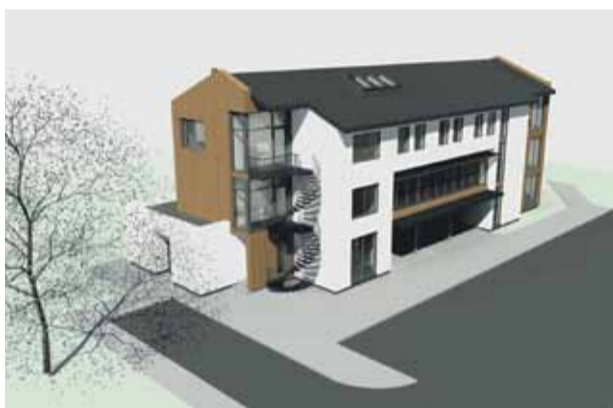
Parakstīts līgums par sabiedriskās ēkas būvniecību Jaunmārupē