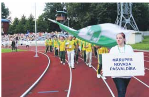
Mārupe pirmo reizi kā novads startē Latvijas Olimpiādē