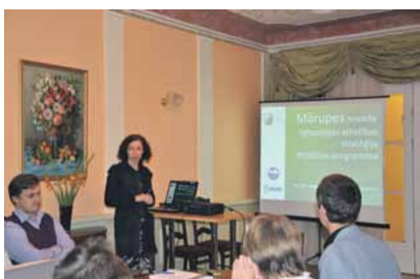
Darba grupa strādā pie Mārupes teritorijas plānojuma 2014. - 2026. gadam