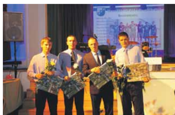
Labākos sportistus sveicam ceremonijā „Sporta laureāts 2012”