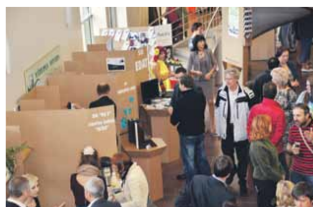
Pirmo reizi tiek rīkota Mārupes novada uzņēmēju diena