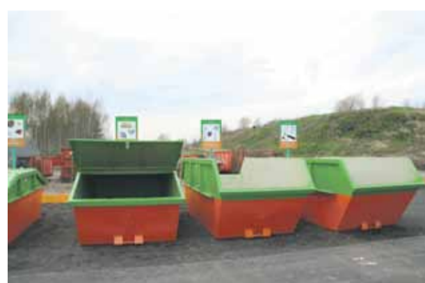
Pateicoties biedrībai „Eko Line”, novadā atvērts atkritumu šķirošanas laukums