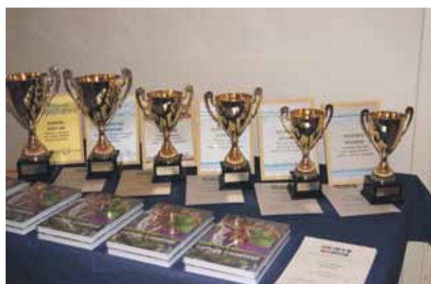
Pierīgas novadu 2012. gada sporta spēļu kopvērtējumā Mārupes novads izcīna augsto 2. vietu