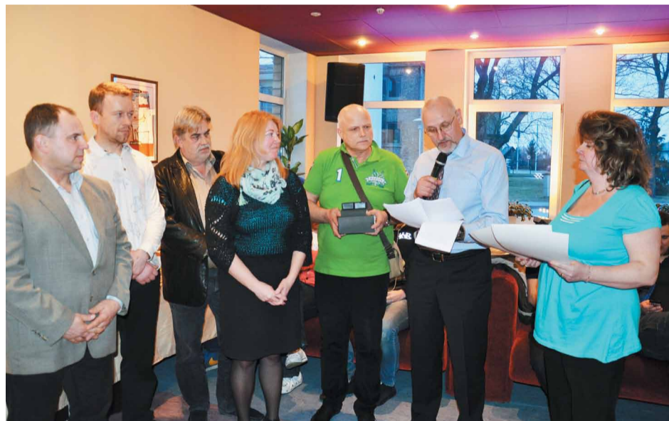
Ar 3.vietu tiek sveikta Mārupes novada Domes komanda