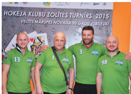
Turnīra 1.vietas ieguvēji – hokeja klubs „Mārupe”