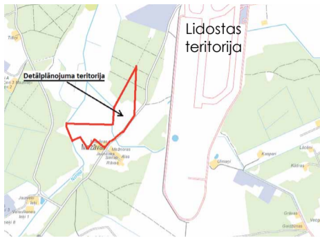
Mārupes novada Dome 2015.gada 8.septembrī ir pieņēmusi lēmumu Nr.1 (protokols Nr.15) "Par Mārupes no-

vada Domes 2015.gada 25.februāra sēdes lēmuma Nr.9 atcelšanu un nekustamā īpašuma „Mazāvas”, kadastra Nr. 8076 005 0001, Mārupes novadā, detālplānojuma izstrādes uzsākšanu, apstiprinot darba uzdevumu jaunā redakcijā”.