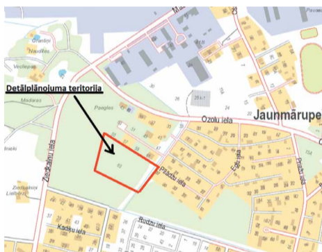
Mārupes novada Dome 2015.gada 28.oktobrī ir pieņēmusi lēmumu Nr.9 (protokols Nr.18) "Par nekustamā

īpašuma Ozolu iela 63, Jaunmārupe, Mārupes novads (kadastra Nr. 8076 011 0940), detālplānojuma izstrādes uzsākšanu”.