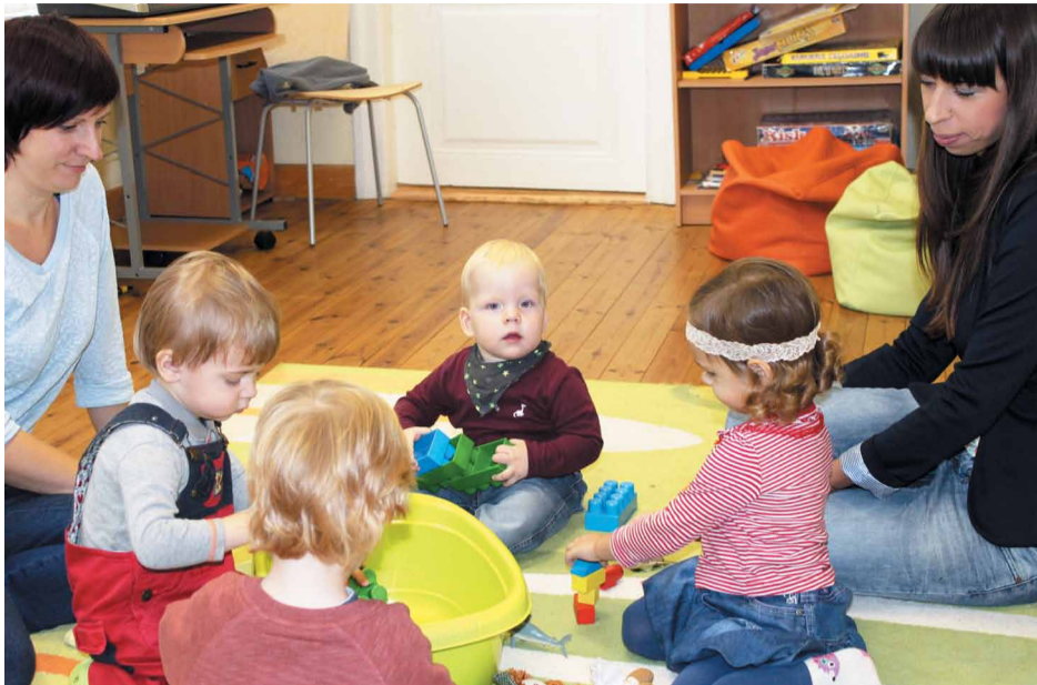
Nodarbībās tiek attīstīta bērna intelektuālā domāšana, dzirde, runa, ritma izjūta, balss, fiziskā koordinācija, radošums un komunikācijas prasmes

Jau otro gadu Jaunmārupē, dienas centrā „Švarcenieki”, notiek muzikāli radošas nodarbības bērniem no gada vecuma „Mazais Gudrinieks”. Katrā nodarbībā tiek integrētas kustību spēles, dziedāšana, mūzikas klausīšanās, instrumentu spēle, aplicēšana, zīmēšana un veidošana.