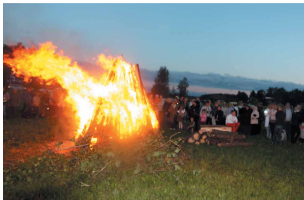
Katru gadu arvien kuplākā pulkā ielīgojam Jāņus