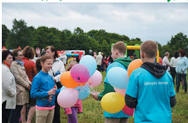
Svinam bērnu un jauniešu svētkus "Ar vasaru saujā"