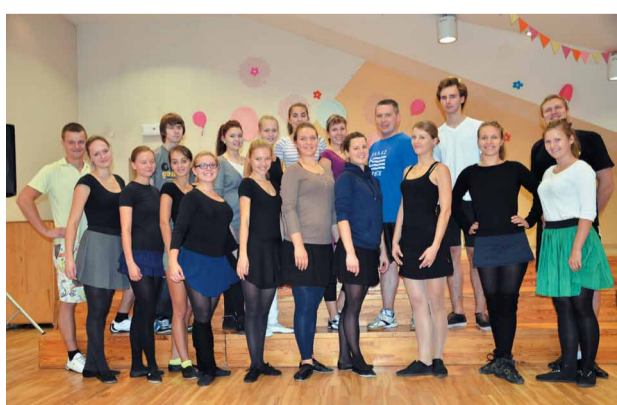
Mārupei nu arī savs jauniešu deju kolektīvs