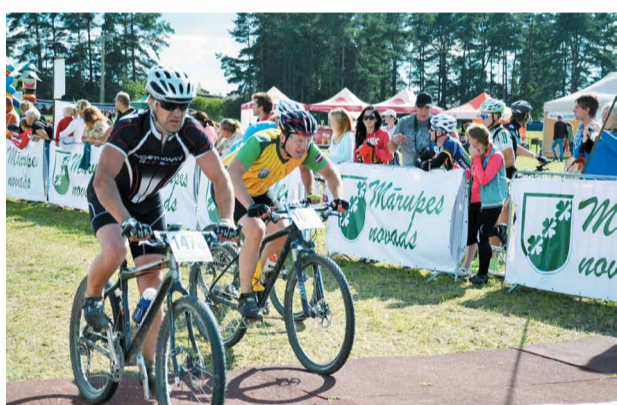
Pirmo reizi novadā Starptautiskas MTB sacensības