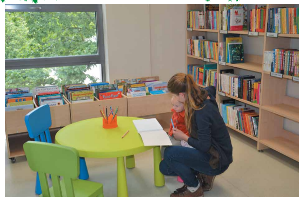
Mazcenas bibliotēka uzsāk darbu jaunās telpās