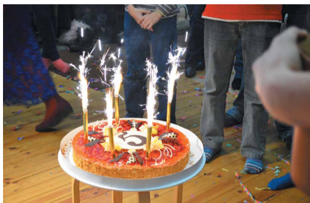
Dienas centri "Tiraine" un "Švarcenieki" nosvin 5 gadu jubilejas