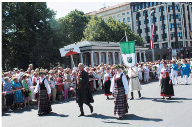
Mārupes novads Dziesmusvētku gājienā