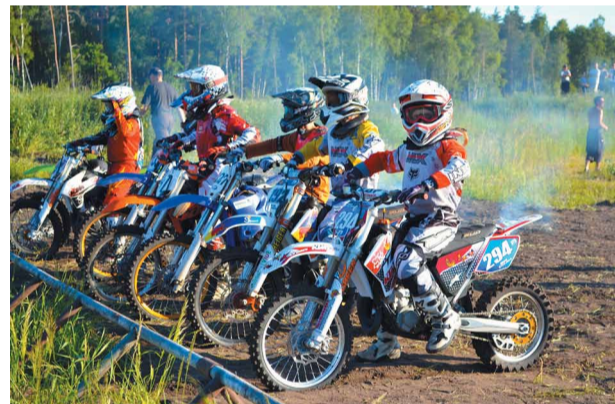
Jaunmārupē vasarā aizvadīts Mini Motokrosa seriāls