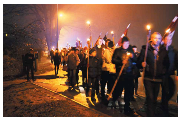
Lāčplēša dienā esam kopā lāpu gājienā