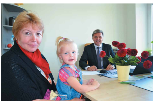
Pašvaldība uzsāk aukļu pakalpojuma līdzfinansēšanu