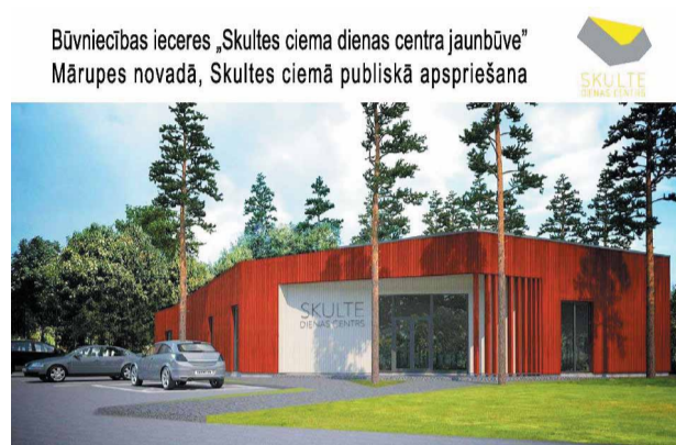
Būvniecības ieceres „Skultes ciema dienas centra jaunbūve” Mārupes novadā, Skultes ciemā publiskā apspriešana