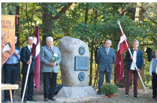
Novadā izveidota atceres vieta Latvijas armijas karavīru godināšanai