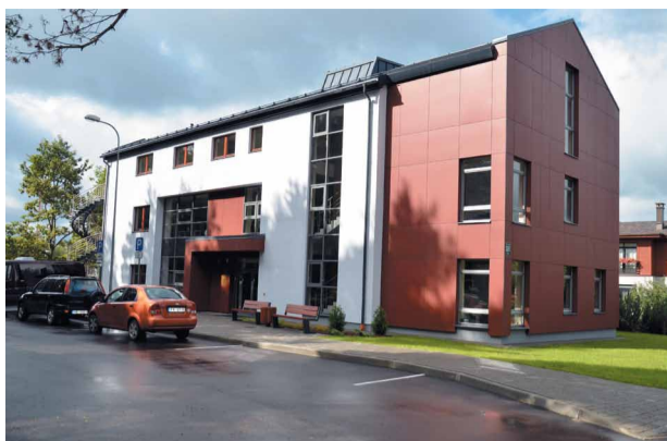
Atklāta Jaunmārupes sabiedriskā ēka