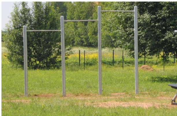
Novadā ierīkoti 5 jauni ielu vingrošanas laukumi