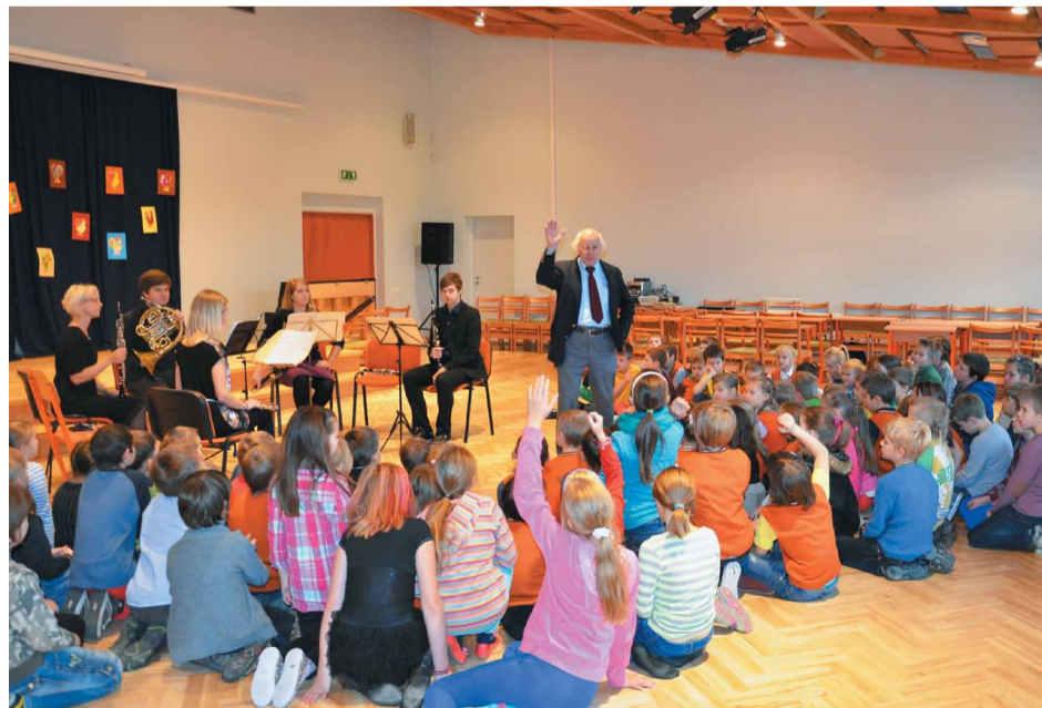
Bērni aizraufīgi iesaistījās sarunā par skaņdarba skaņējumu