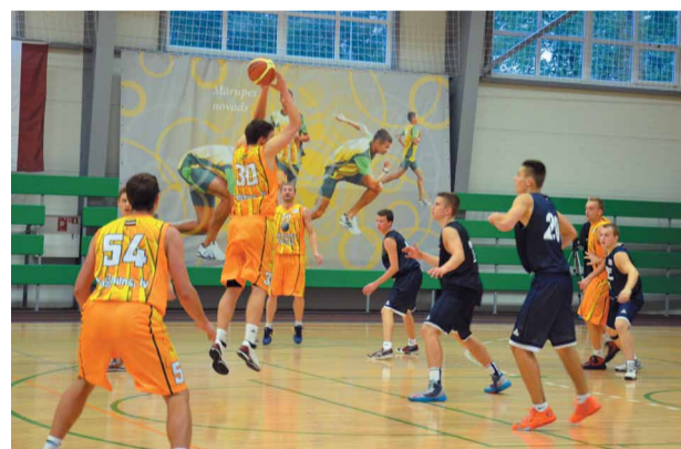
Basketbola komanda "Mārupe" debitē Latvijas Basketbola līgas 2.divīzijā