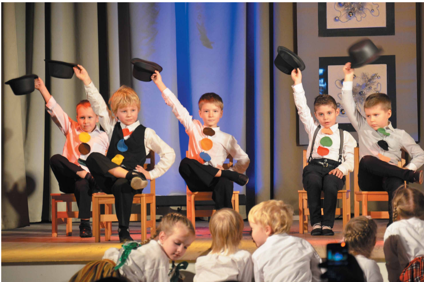
Bērnu adventes koncertā pati daba bija ar mums - līdz ar balto sniegu aiz loga, sniegavīri bija arī uz Mārupes Kultūras nama skatuves. Sniegavīru deju izpilda bērnu dārza "Zeltīti" audzēkņi.