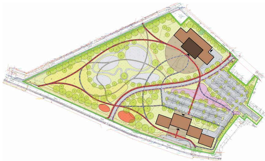
Teritorijas izmantošanas priekšlikums

Turpinot pašvaldības funkciju nodrošināšanai paredzētās publiskās teritorijas attīstības ieceres izstrādi, Mārupes novada Dome 2015.gada 30.martā ir pieņēmusi lēmumu Nr.14 (protokola Nr.3) „Par Mārupes novada Tīraines ciema nekustamo īpašumu „Tīraines dārzi-1” un „Tīraines dārzi-2” detālplānojuma projekta nodošanu publiskajai apspriešanai”.