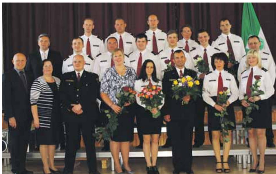
Mārupes novada Pašvaldības policijas darbinieki, Mārupes novada Domes vadība un Iekšlietu ministrijas valsts sekretāre Ilze Pētersone

10.maijā Mārupes novada pašvaldības policisti pulcējās Mārupes Mūzikas un mākslas skolas zālē, lai svinīgi nodotu zvērestu, apliecinot savu apņemšanos kalpot Mārupes novada iedzīvotājiem un visai Latvijas tautai.