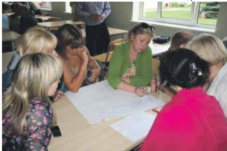
Iedzīvotāji Tīrainē strādā darba grupā

Lai arī pašvaldība organizē skolēnu nokļūšanu līdz mācību iestādēm un kopumā šo pakalpojumu vērtē kā ļoti organizētu, daļa iedzīvotāju lūdz pārskatīt autobusu