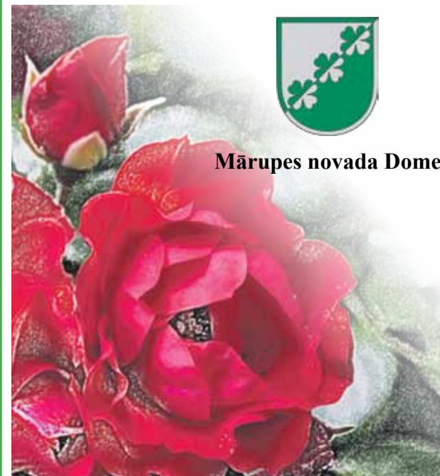
Mārupes novada Dome

Vēlam veselību, dzīvesprieku un spēku turpmākajiem dzīves gadiem!