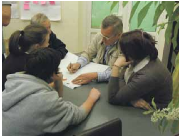
Iedzīvotāji Skultē strādā darba grupā

Lai arī novadā tiek rekonstruēta ūdenssaimniecības un kanalizācijas sistēma, šie pakalpojumi nav pieejami visiem novada iedzīvotājiem. Tāpat tiek norādīts uz augstajiem tarifiem.