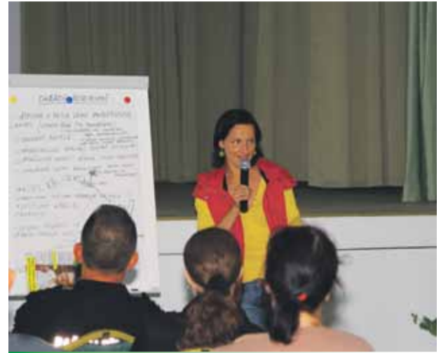
Iedzīvotāji Mārupē prezentē darba grupu priekšlikumus

kursēšanas grafiku un maršrutus, pielāgojot tos arī, piemēram, Mārupes mūzikas un mākslas skolas nodarbību grafikam.