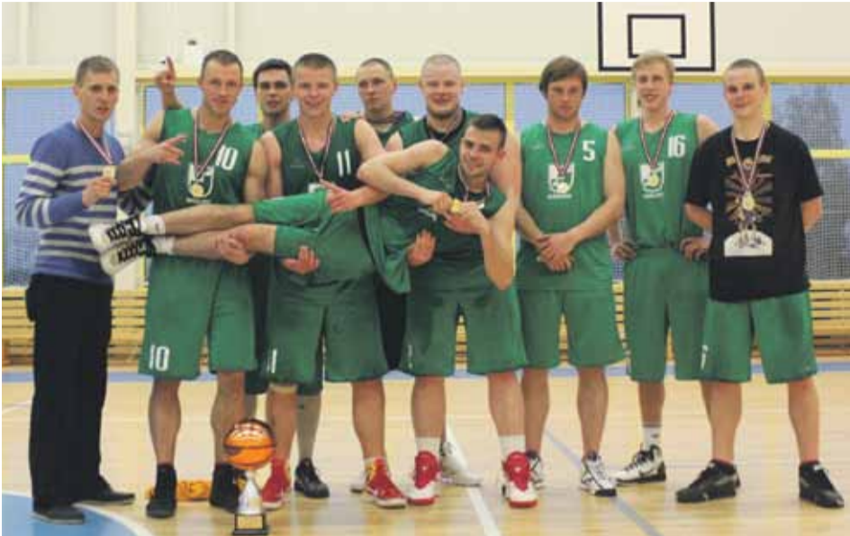
1.vietas ieguvēji – komanda „Mārupes Sporta centrs”