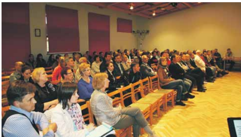
Iedzīvotāji Jaunmārupē klausās prezentāciju par novadu

aktuāls jautājums ir Mārupes gatves un Daugavas ielas krustojums, kas satiksmes intensitātes dēļ neatbilst drošības standartiem. Kā arī tika izteikts ierosinājums izveidot apļveida kustību pie Domes, lai atslodotu automašīnu kustību šajā krustojumā. Tīrainē aktuāls jautājums ir izbraukšanas iespējas uz Vienības gatvi, ierosinājums uzsākt sarunas par luksofora ierīkošanu. Tiek ierosināts izveidot Park&Ride stāvvietu pie Tīraines stacijas auto un velo transportam. Lai risinātu telpisko sasaisti ar pārējo novadu, Skultes ciemā ļoti aktuāla ir satiksmes infrastruktūras uzlabošana, tiek izvirzīta ideja savienot Skultes ielu ar Dzirmieku ielu pa tuneli zem lidostas skrejceļa.