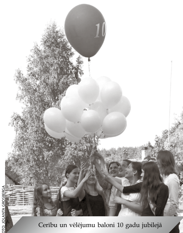
Cerību un vēlējumu baloni 10 gadu jubilejā