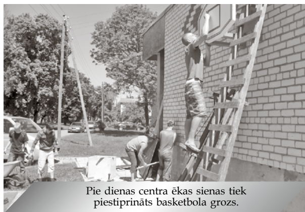
Pie dienas centra ēkas sienas tiek piestiprināts basketbola grozs.

Bērnu un jauniešu dienas centrā "Tiraine" jauniešiem ļoti patīk sportot un piedalīties dažādos turnīros gan iekštelpās, gan