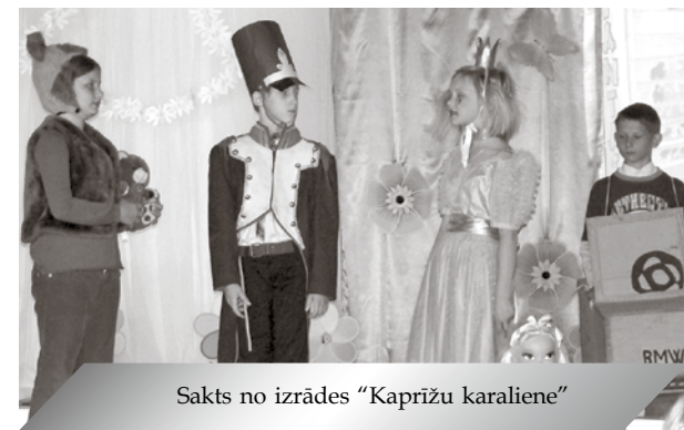
Sakts no izrādes "Kaprižu karaliene"