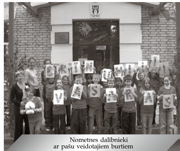
Nometnes dalībnieki ar pašu veidotajiem burtiem