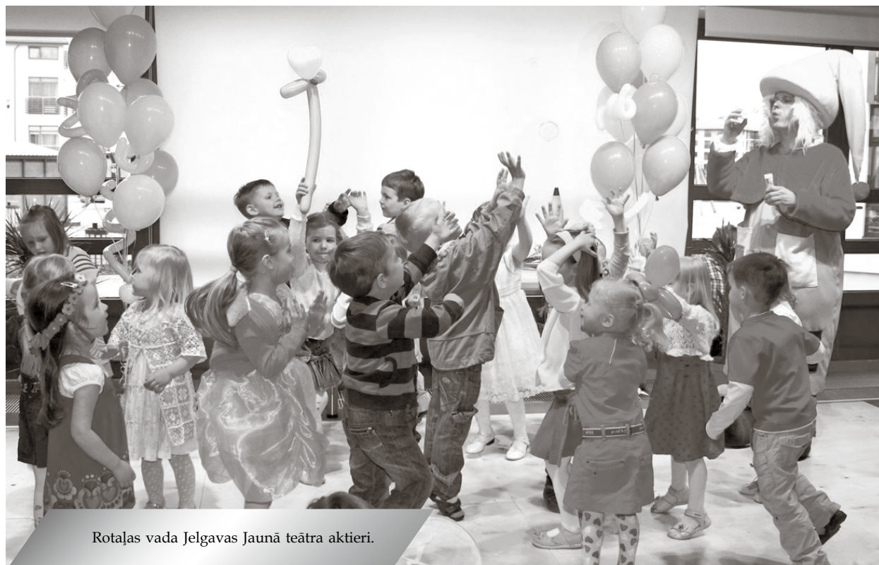
Rotaļas vada Jelgavas Jaunā teātra aktieri.