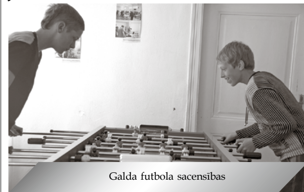
Galda futbola sacensības