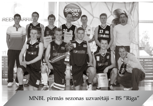
MNBL pirmās sezonas uzvarētāji – BS "Rīga"

Biedrība "Mārupes novada basketbola līga" cer sadarbībā ar Mārupes novada Domi un citiem atbalstītājiem veiksmīgi