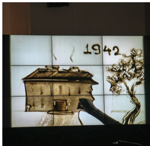
Visa svētku lielkoncerta laikā maģisku noskaņu radīja smilšu kino projekcijas, kurās tika ieausti Mārupes novada un Kultūras nama ēkas stāsti