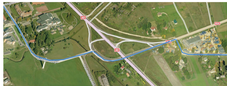
2017.gadā plānots uzsākt velociņa Mārupē - Jaunmārupē izbūvi

Ar Jaunmārupes ciema attīstības vīzijas prezentāciju aicinām iepazīties pašvaldības mājaslapā www.marupe.lv .