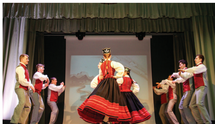
Ar spilgtiem deju priekšnesumiem skatītājus lielkoncertā priecēja vidējās deju paaudzes kolektīvs "Mārupieši"