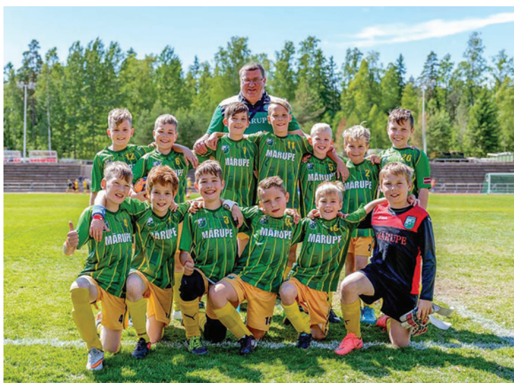
Mārupes Sporta centra futbolisti Somijā