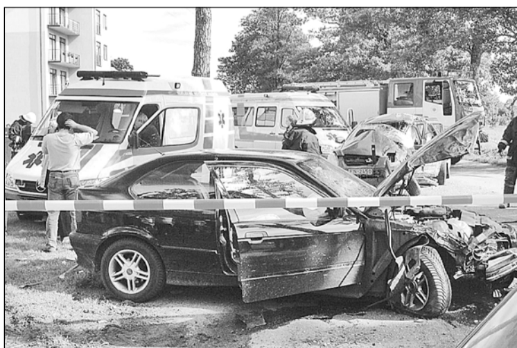
Diemžēl 5. septembrī netālu no Mārupes vidusskolas, Kantora un Lielās ielas stūrī, notika ļoti traģiska avārija – autobuss, kas saskaņā ar līgumu pārvadā Mārupes pagasta skolēnus, krustojumā saskrējās ar vieglo automašīnu un iebrauca mājas stūrī. Nelaimē gāja bojā vieglās automašīnas šoferis, cieta vēl viena pretī braucošā mašīna un tika sabojātas 2 pagalmā stāvošas vieglās automašīnas. Neiztirzājot ceļu satiksmes negadījuma apstākļus, jāsaka vien paldies liktenim, ka šajā vietā nebija vairāk bojā gājušo, jo autobuss brauca pēc bērniem. Sācies skolas laiks, vadītāji – esiet īpaši uzmanīgi, skolēni – neesiet pārgalvīgi, un vecāki – pārlicinieties, ka jūsu bērni zina CSN un saprot to nozīmīgumu!