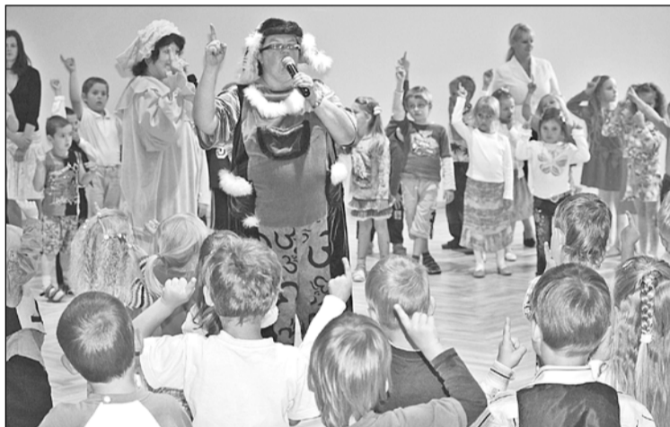
Mazākajiem Jaunmārupes sākumskolas audzēkņiem – pirmsskolas grupiņām – svētku noskaņu ar jaukiem padomiem mācībām sagādāja Valmieras kultūras nama aktieri ar rotaļu izrādēm "Ežu skola" un "Rukša un Dukša skolu".