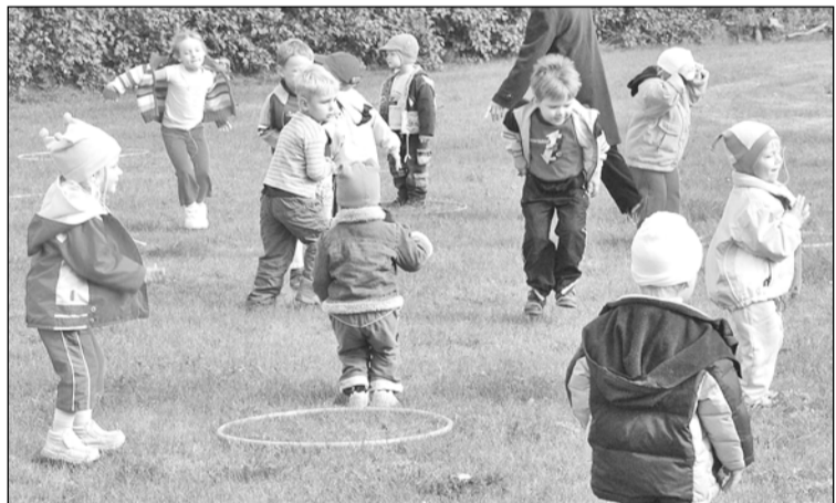
12. septembrī sportoja Jaunmārupes bērnu dārznieki, kopā ar savām audzinātājām un auklītēm ceļojot pa ežu takām, lēkājot kā zaķiši un lidojot kā taurenīši.