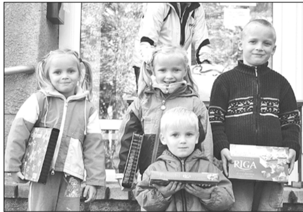
Paši mazākie dalībnieki.