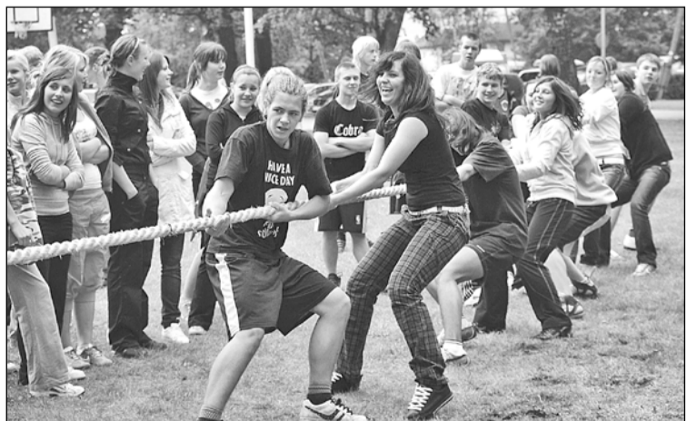
Mārupes vidusskolas stadionā un laukumos notika sacensības virves vilkšanā, basketbola metienos, futbola sitienu, tāllēkšanas stafetē, frisbija spēles elementos (šķīvīša mešana mērķī), 1. un 2. klases sporta zālē sacentās veiklības stafetē.