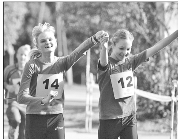
Daudzi skrējēju pavadīja šādā optimistiskā noskaņojumā, jo ne vienmēr galvenais ir uzvara