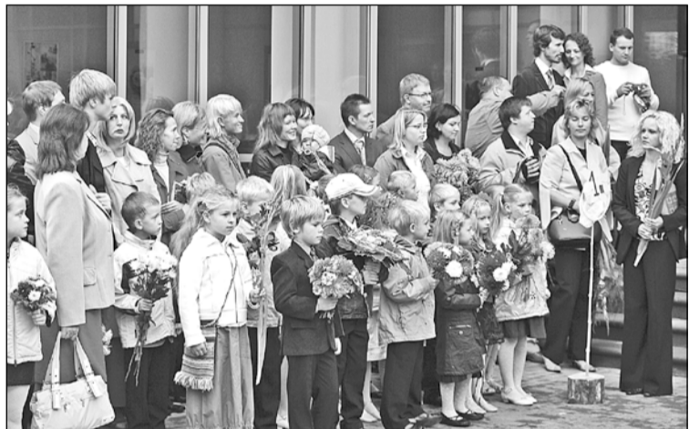
Smaidīgi, saposti, gaidu pilni un mazliet nobijušies – Jaunmārupes sākumskolas 1.a klases skolēni.

Pirmdienas rītā no mālu malām uz skolām devās kā lieli, tā mazi – pirmajās klasēs Mārupes pagastā mācības uzsāka 148 bērni, Mārupes vidusskolas 10. klasēs – 48 skolēni.